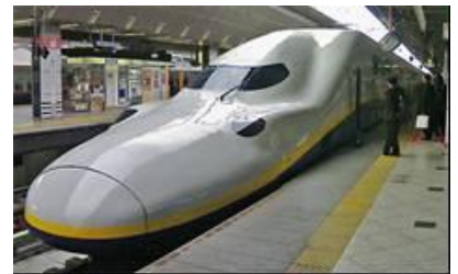
現在のE4系車両(イメージ)