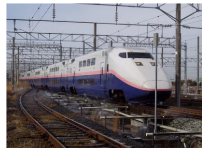
かつて上越新幹線で運用していた朱鷺色ラインのE1系車両(イメージ)