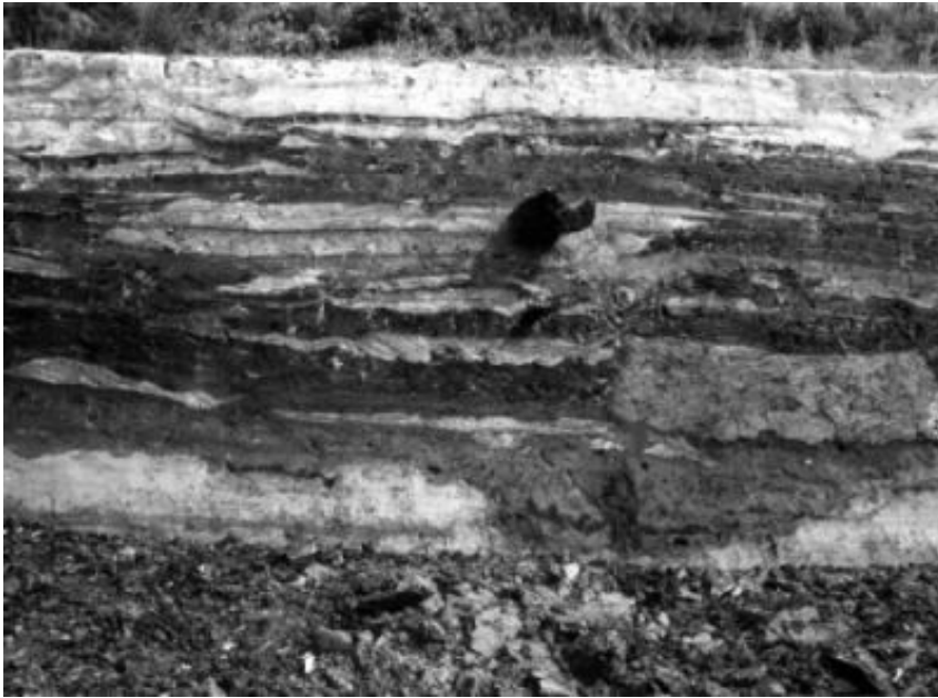
Abb. 1: Beispiel eines Querschnitts durch eine Wurt (Feddersen Wierde, Röm. Kaiserzeit). Dunkle Siedlungsschichten liegen im Wechsel mit hellen Auftragsschichten. Die Höhe der untersten Siedlungsschicht liefert ein Datum für die Meeresspiegelkurve in Abb. 2. (Grabung Haarnagel).

Die Hauptquelle archäologischer Daten sind die Flachsiedlungen (ohne Aufhöhung auf dem flachen Marschboden errichtet) und die Wurt (gegen Sturmfluten aufgetragene Wohnhügel, auch Warfen genannt). Damit ihre Höhe für die Abschätzung des früheren Sturmflutspiegels verwendet werden kann, muss sichergestellt sein, dass die jeweilige Siedlung auch ganzjährig und nicht nur im Sommer benutzt wurde. Dieses ist häufig am Nachweis von Wohn-Stallhäusern erkennbar, deren Grundrisse eine winterliche Aufstallung des Viehs zeigen.