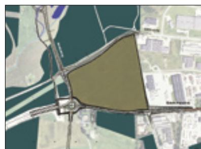
5. Byggeomdning af erhvervsområde på Sintrupvej og forlængelse af Sintrupvej