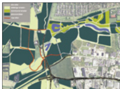
2. Skovrejsning og anlægning af skovveje, True Skov