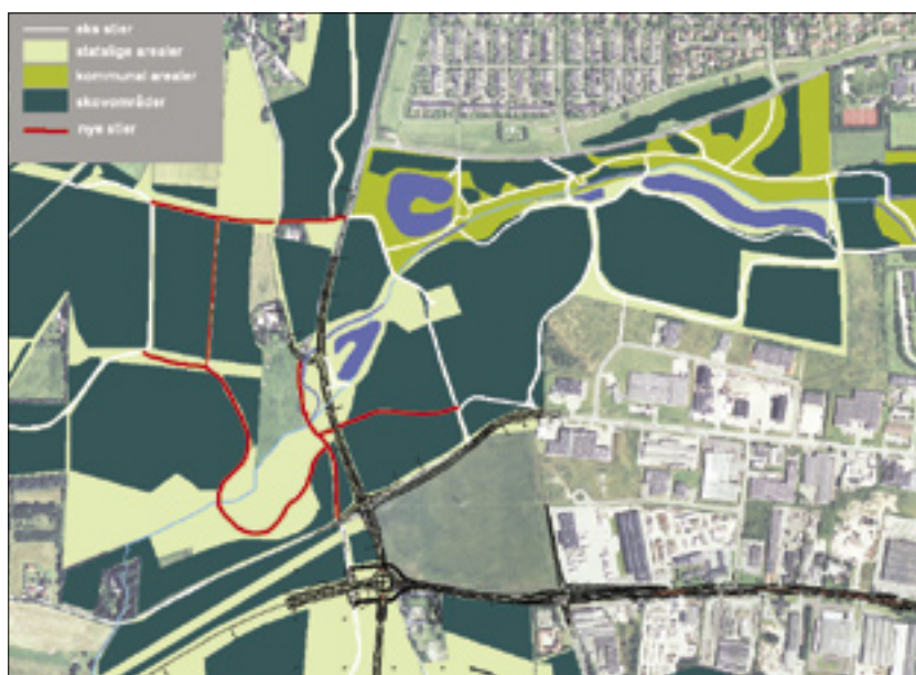
Skovrejsning og anlægning af skovveje i True Skov.