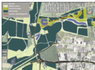
3. Anlægning af stianlæg på det kommunalt ejede område, True Skov