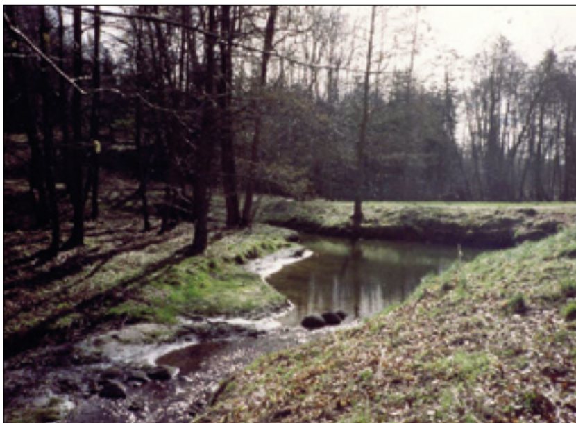
Omkring Voldbækken anlægges arealer med græs til afslåning eller afgræsning.

De træer, der skal plantes, er overvejende almindelige skovtræer som eg, bøg og ask, men der plantes også et par arealer med tjørn til frøhøst. Omkring Voldbækken bliver der åbne arealer med græs til afslåning eller afgræsning.