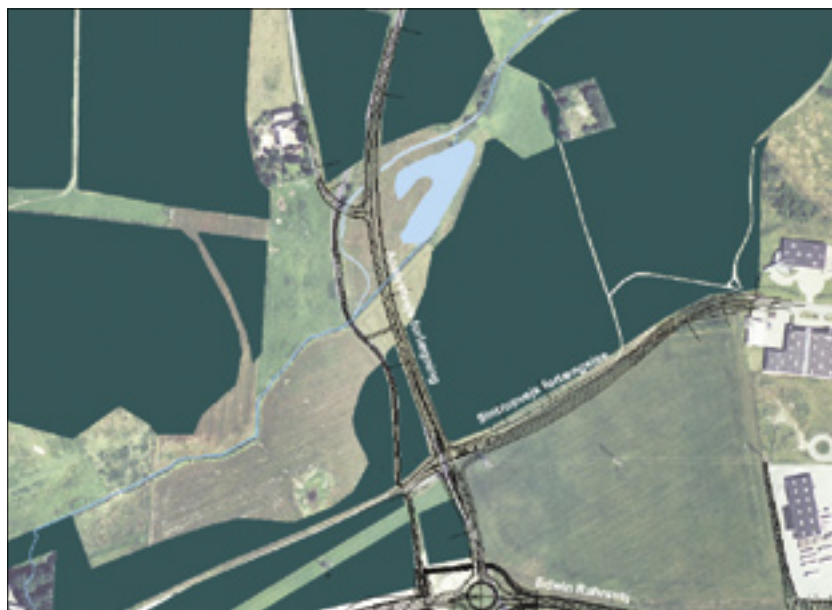
Forlægning af Anelystvej.

I forbindelse med anlægsarbejdet er det nødvendigt i perioder at lukke for trafikken på Langhøjvej og Rætebølvej. Vejlukningerne bliver koordineret med Århus Amts busstrafik.