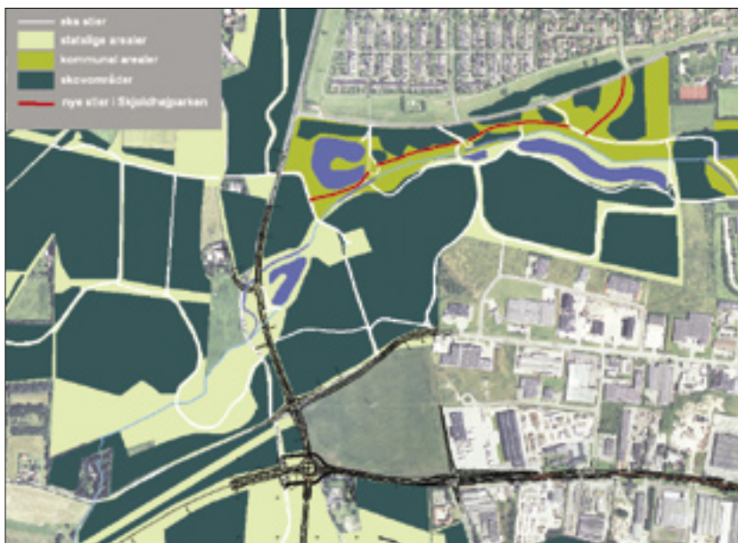
De nye stianlæg vil skabe sammenhæng mellem Hasle Bakker og til True Skov

Sideløbende med stierne anlægges en mindre bakke mellem Skjoldhøjvej og Voldbækken, hvor arealet i dag ligger lidt lavere end vejen. Målet er, at brugerne fra bakken kan få en god udsigt over de kommende søer. Som en sideeffekt vil bakken også lukke af for udsigten til bilerne på Skjoldhøjvej.