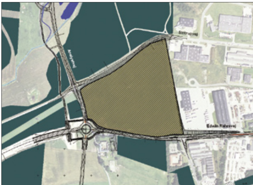
Det kommende erhvervsområde ligger omkranset af grønne arealer.

Den nye vejforbindelse mellem Sintrupvej og Anelystvej giver samtidig det øvrige eksisterende erhvervsområde ved Sintrupvej en mere direkte adgang til motorvejene vest for Århus. Vejforbindelsen vil samtidig aflaste en del af Edwin Rahrs Vej.