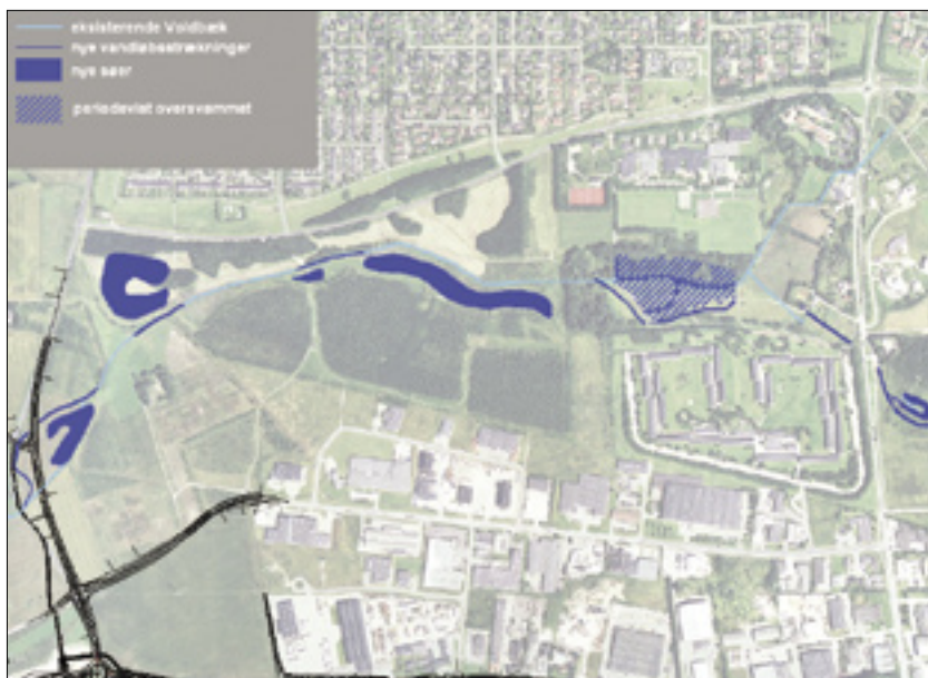
Ændring af regnvandsbassiner og restaurering af Voldbækken.