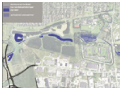
1. Ændring af regnvandsbassiner og restaurering af Voldbækken

15. marts 2005 Rådmand Poul B. Skou Magistratens 2. afdeling Århus Kommune