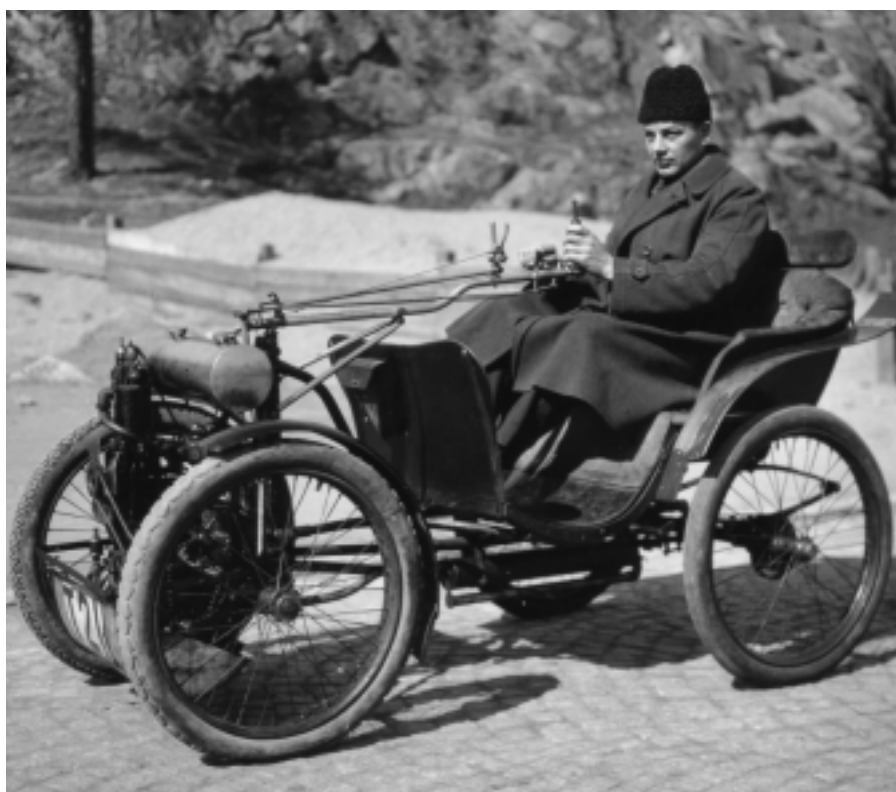
Denna Victoria Combination har en tvåcylindrig "motorhäst" som drar ett ledat hästvagnsliknande lätt släp.