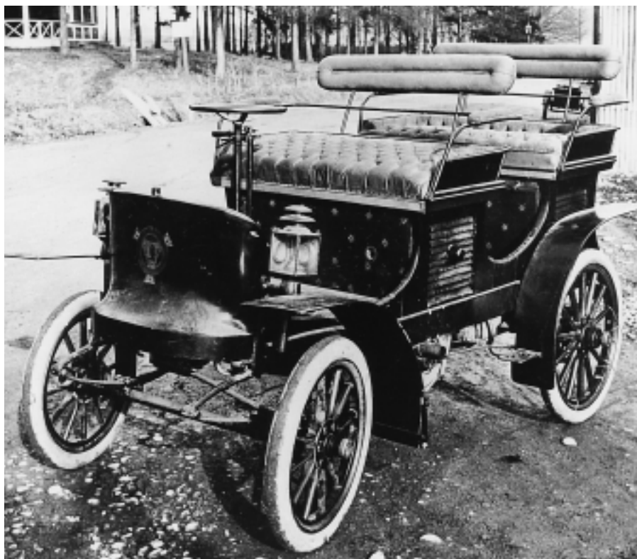
"Scania-Automobil, lätt promenadvagn för fyra personer 6 hk. 2 hastigheter fram, 1 back" står det på ritningen från 1902. I mitten, längst ner syns motorn. Kraften överförs med kedjor till bakaxelns två kardanaxlar.