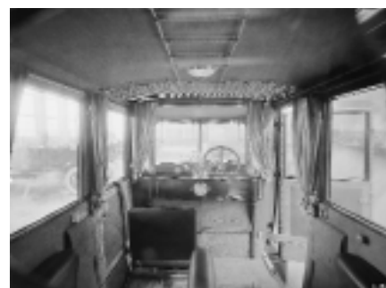
Interiör från en Scania-Vabis personbil från 1920-talets början.