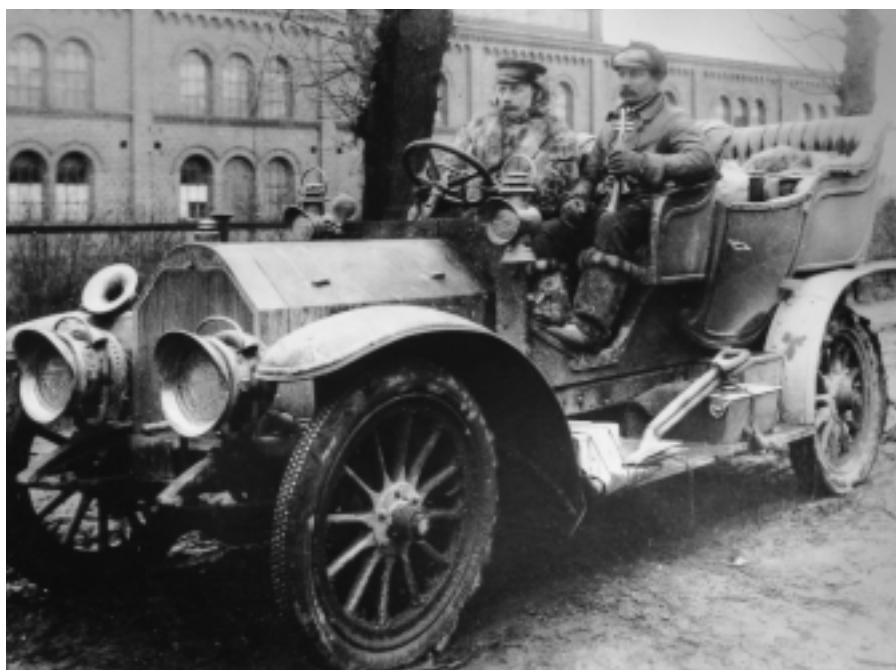
Företagen byggde slitstarka bilar. Denna deltog i en vintertävling 1907.