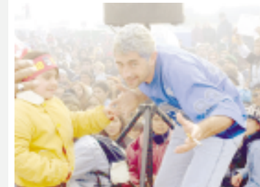
Imagen. Los fans imitaron al Potro durante la jornada

El juicio contra el empresario Alfredo Pesquera acusado de causar la muerte de Rodrigo se iniciará recién a fines de octubre.