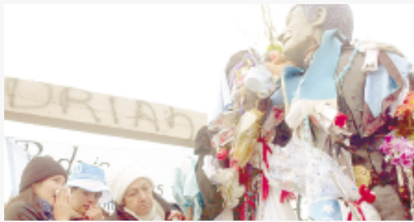
Entrega. Los fans rezaron y lloraron junto a una estatua con la figura del cuartetero cordobés

Más de 20 mil personas pasaron ayer por el santuario. Los fans, quizás, lo graron demostrar que lejos de morir, Rodrigo Bueno quedó eternizado en la memoria de cada uno de ellos con su música y sus canciones.