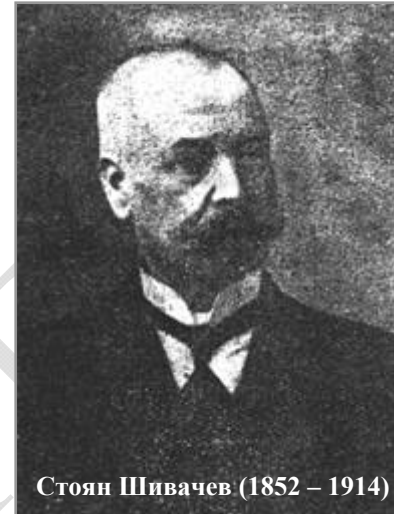
Стоян Шивачев (1852 – 1914)