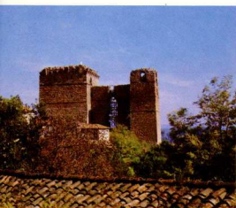
12. Πυθιον. Το κάστρο (νότια όψη).

όπως και η εκκλησία του Χριστού είναι κτίσματα του 19ου αι., ιδιρμένα σε θέσεις βυζαντινών ναών.