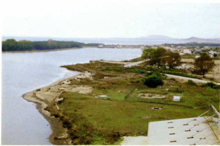
3. Πόρτο-Λάγο. Η θέση τού βυζαντινού οικισμού· διακρίνεται ό βυζαντινός ναός και τμήμα τών τειχών κοντά στή θάλασσα.