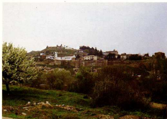
10. Διδυμότειχον. Γενική άποψη τής βυζαντινής πόλης.