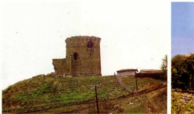
11. Πυθιον. Το κάστρο (δυτική όψη).

οικισμό γνωστό από τις βυζαντινές πηγές σαν έδρα επισκοπής, από τον 9ο μέχρι τον 14ο αι., υπαγόμενη στον μητροπολίτη Τραινουπόλεως. Όρατά τμήματα του βυζαντινού οικισμού είναι μέρος του οχυρωματικού του περιβάλλου, με κυκλικούς και ορθογώνιους πύργους και τρείς ναοί που άποκαλύφθηκαν πρόσφατα. Ό πρώτος ναός, τρίκλιτη μεσοβυζαντινή βασιλική, 9ου-10ου αι. άποκαλύφθηκε εντός του σημερινού οικισμού και δίπλα στη μεταβυζαντινή έκκλησία τής Άγίας Άναστασίας (1800-1833). Στίς άρχές του 20ου αι. κτίσθηκε πάνω στά έρείπια τής βασιλικής τού μουσουλμανικό τέμενος τής Μάρκρης.