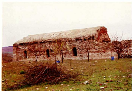
8. Τραιανουπολις. Η «Χάνα».

Γρατιανού - Γρατινή. Κοντά στον σημερινό οικισμό της Γρατινής κτισμένο στους πρόποδες της Ροδόπης, σώζονται ερείπια και οχύρωση έπο-