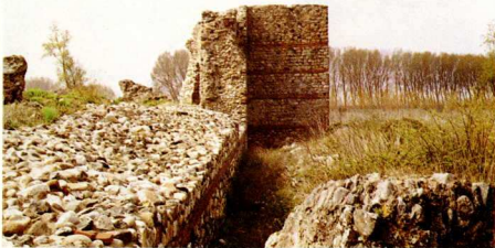
4. Άνασασιούπολις. Τμήμα τού οχυρωματικού περιβόλου.

Η περιμέτρος τών τειχών σώζεται σχεδόν στό σύνολό τής· έχει σχήμα πολυγωνικό και ένισχύεται σέ τακτά διαστήματα μέ όρθογώνιους και κυκλικούς πύργους (εικ. 4). Στόν όχυ-