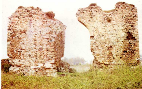
5. Αναστασιουπολις. Τοξωτή πύλη στη νότια πλευρά της οχύρωσης.