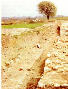
6. Μαυριανουπολις - Μουσουνοπιλις. Τμήμα οχύρωσης.

Μουσουνοπόλις υπήρξε συχνά στρατόπεδο έκστρατειών. Πέρα από τις συχνές περιγραφές της οχύρωσης από τον Χωιάτη, μνημονεύονται και δημόσια λουτρά, που χρησιμοποιούσαν οι αυτοκράτορες κατά τις διαμονές τους στην πόλη.