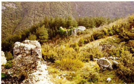
1. Ξάνθεια (Ξανθή). Ερείπια βυζαντινού οχυρωματικού περιβόλου.

πραγμένα της συνόδου του 879, που συγκροτήθηκε στην Κωνσταντινούπολη, όπου αναφέρεται ο επίσκοπος της Ξάνθειας Γεώργιος. Την εποχή αυτή αποτέλεσε μικρό άστικό οικισμό και η προαγωγή της σε επισκοπή, που έγινε στον 8ο-9ο αϊ., απόβλεπε στην κοινωνική ενίσχυσή της.