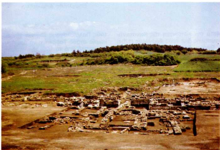
2. Αθήτρα - Πολύστουλον. Μεσοβυζαντινή βασιλική.

Πόρτο - Λάγο. Δυτικά της λίμνης Βιστωνιδας (Πόρτο-Λάγο), δεξιά και άριστερά από την 'Εθνική όδο Ξάνθης - Κομοτηνής και μέχρι τη θάλασσα, σώονται τά ερείπια βυζαντινού οικισμού, που ήλθαν στό φώς με παλαιότερες και πρόσφατες άνασκαφικές έρευνες. Μεγάλο τμήμα τό οχυρωματικού περιβόλου που άπο-