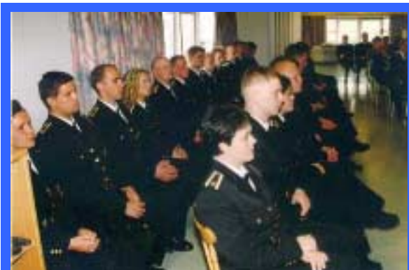
Útskriftarnemar frá Lögregluskóla ríkisins vorið 1999

Þá komu kennarar skólans að kennslu hjá Landhelgisgæslunni eins og mörg undanfarið ár.