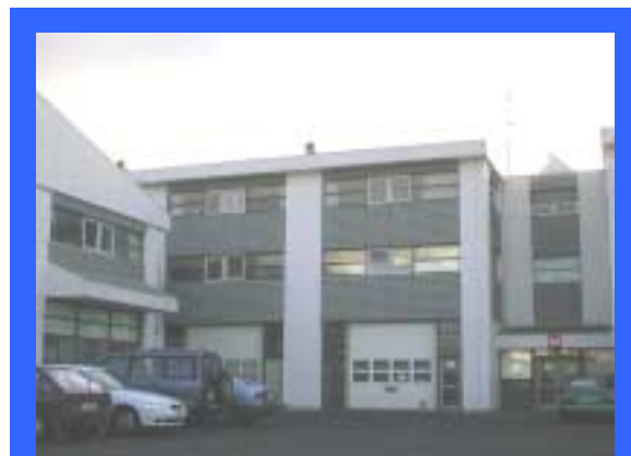
Lögregluskóli ríkisins er starfráttur að Krókhálsi 5a. Á árinu 1999 var bætt við tveimur kennslustofum í húsi 5b.

Skólastjóri Lögregluskóla ríkisins er samkvæmt lögum skipaður af dómsmálaráðherra til fimm ára í senn. Hann skal fullnægja sömu skilyrðum fyrir skipan í embætti og lögreglustjórar, og hafa staðgóða þekkingu á lögreglumálefnum. Yfirlögregluþjónn og aðstoðaryfirlögregluþjónn skulu einnig starfa við skólann og ráðning þeirra er með sama hætti.