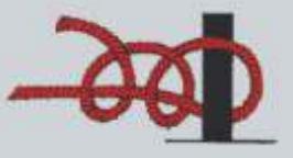
Zwei halbe Schläge

Dient zum Belegen von Festmachern auf Pollern, an einer Reling und anderen festen Gegenständen und ist meistens mit zwei halben Schlägen gesichert