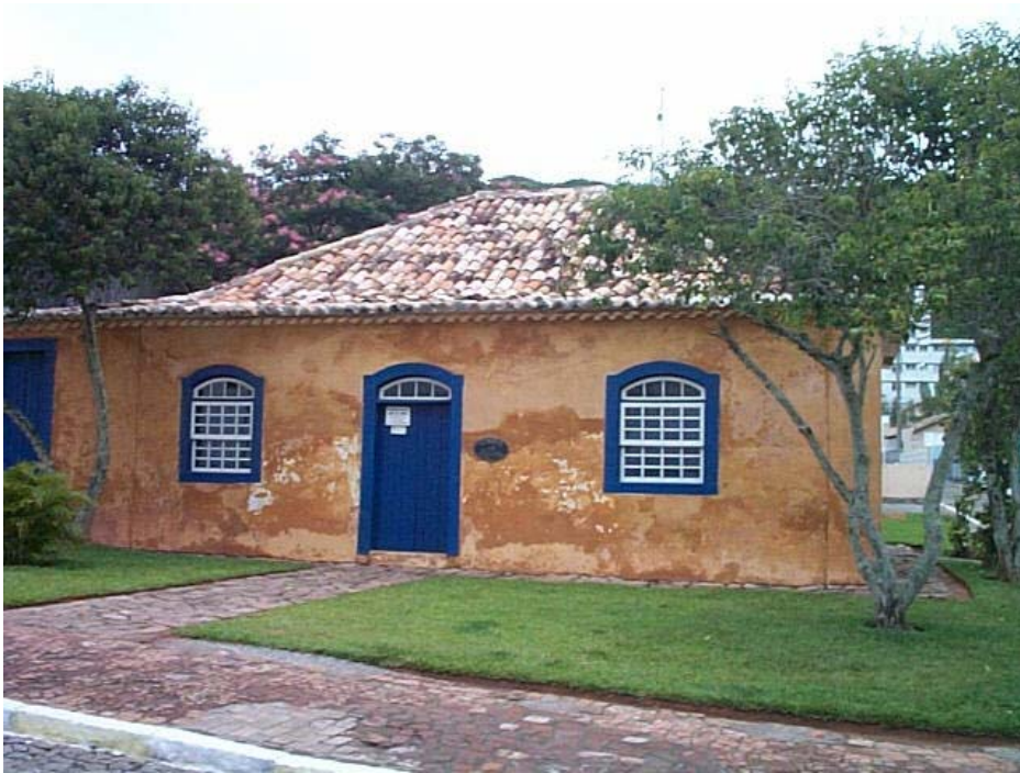
Museu conhecido como a Casa de Anita.

É muito importante salientar que aí, em Santa Catarina, findou efetivamente a carreira de Giuseppe Garibaldi como marinheiro e começou a sua brilhante trajetória como condottiero .