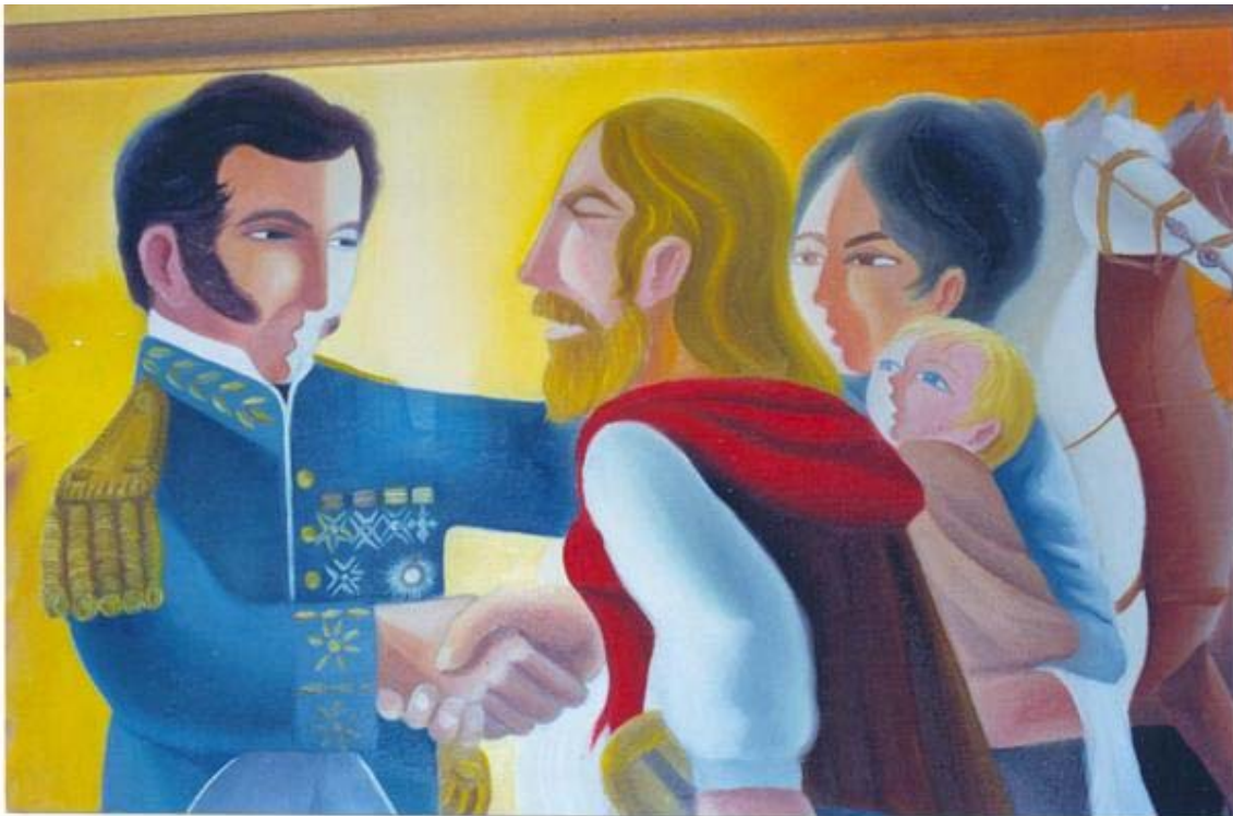
Despedida de Garibaldi.

Após 50 dias percorrendo, aproximadamente, 800km, Garibaldi chega a Montevideú com a família. Estava encerrada sua participação na Revolução Farroupilha.