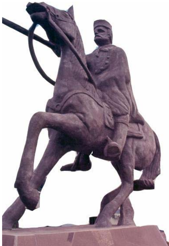
Monumento à Garibaldi, à cavalo, na cidade de Garibaldi.

Em abril, Garibaldi toma parte no cerco a Porto Alegre e, em maio, na indecisa batalha de Taquari, de gigantescas proporções. Em 19 de junho de 1840, chega em Itapuã, o General Antônio de Souza Neto, Garibaldi e o ajudante de ordens, Major Barreto.