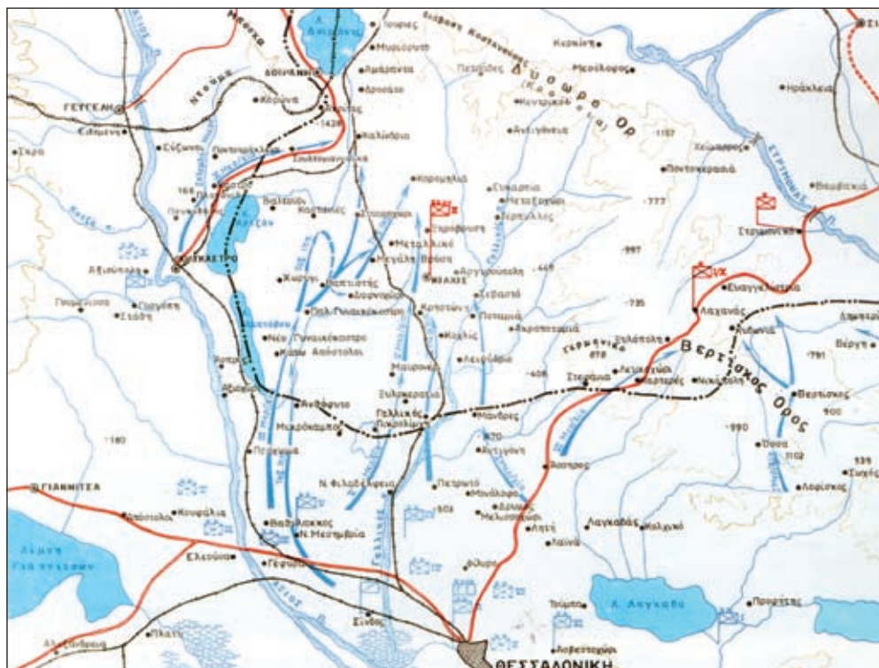
Σχεδιάγραμμα 2: Μάχη Δοϊράνης - Κυριαρχία στην Κοιλάδα Στρώμητιςας

γεωγραφική περίμετρο: περιοχή Αξιού - Μοράβας - παραδουνάβια περιοχή Δοβρουτσάς - Τσατάλτζα - Παγγαίο όρος - περιοχή Θεσσαλονίκης. Μέσα σε αυτή την ευρύτερη περιοχή, το ελληνοβουλγαρικό θέατρο επιχειρήσεων εκτεινόταν από τον Αξίο ποταμό μέχρι την κοιλάδα του Νέστου ποταμού.