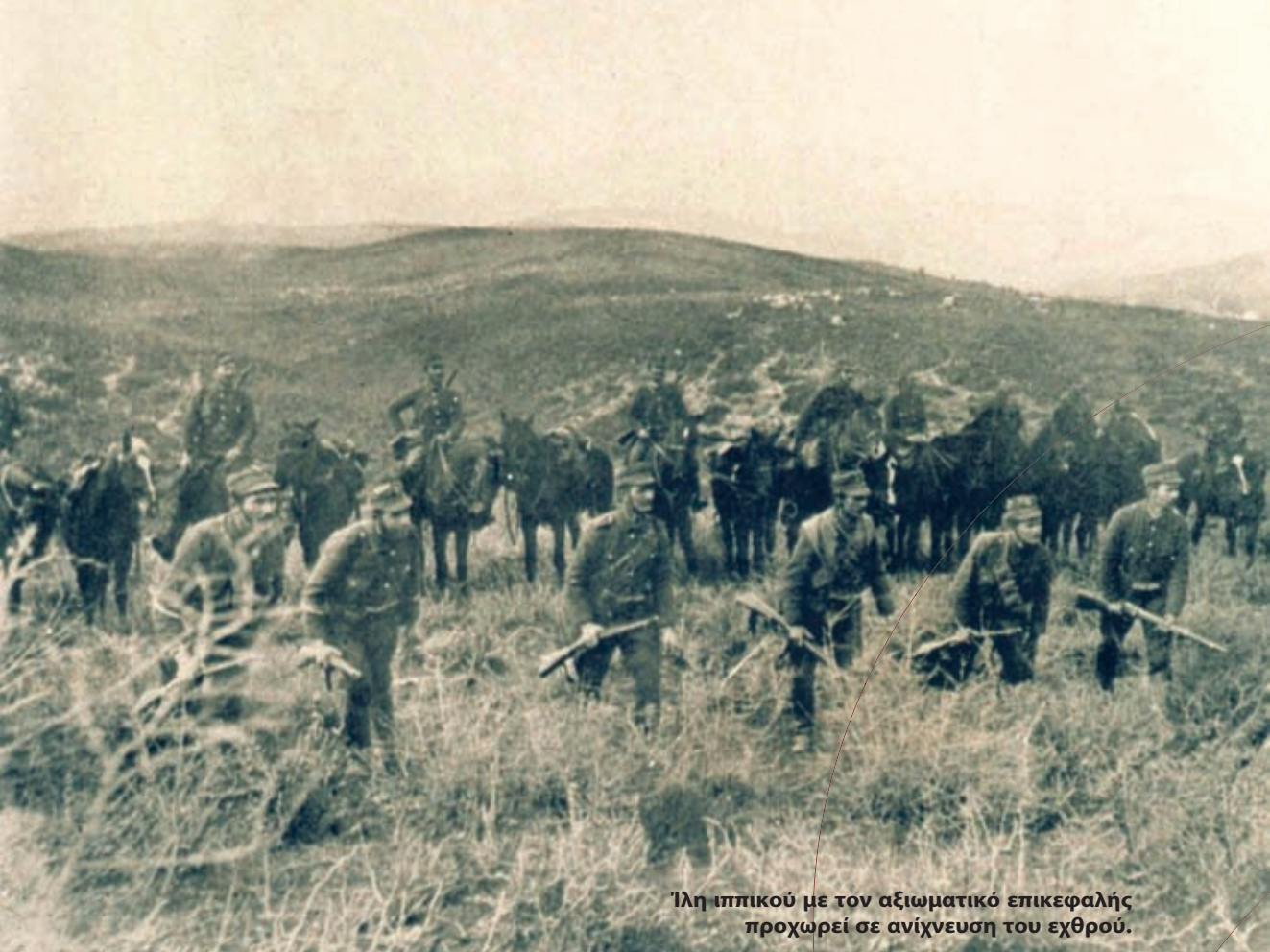
Έλη ιππικού με τον αξιωματικό επικεφαλής προχωρεί σε ανίχνευση του εχθρού.

σαν τον αγώνα σε ολόκληρο το μέτωπο, χωρίς όμως να καταφέρουν το επιδιωκόμενο αποφασιστικό πλήγμα στις βουλγαρικές δυνάμεις. Στις 15 Ιουλίου, και ενώ τα ελληνικά στρατεύματα συνέχιζαν την επίθεση κατά του υψώματος Χασάν Πασά και καταλάμβαναν τη γραμμή Τσέροβο, ύψωμα 1.378, εκδηλώθηκε αιφνιδιαστικά βουλγαρικός επιθετικός ελιγμός κατά των δύο άκρων της ελληνικής διατάξεως.