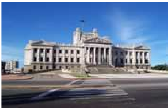
Fachada del Palacio Legislativo, sede del Poder Legislativo