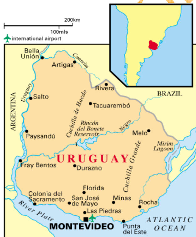
Mapa político de Uruguay

Los 19 departamentos, con sus respectivas capitales, son: Artigas (Artigas), Canelones (Canelones), Cerro Largo (Melo), Colonia (Colonia del Sacramento), Durazno (Durazno), Flores (Trinidad), Florida (Florida), Lavalleja (Minas), Maldonado (Maldonado), Montevideo (Montevideo), Paysandú (Paysandú), Río Negro (Fray Bentos), Rivera (Rivera), Rocha (Rocha), Salto (Salto), San José (San José), Soriano (Mercedes), Tacuarembó (Tacuarembó), Treinta y Tres (Treinta y Tres).