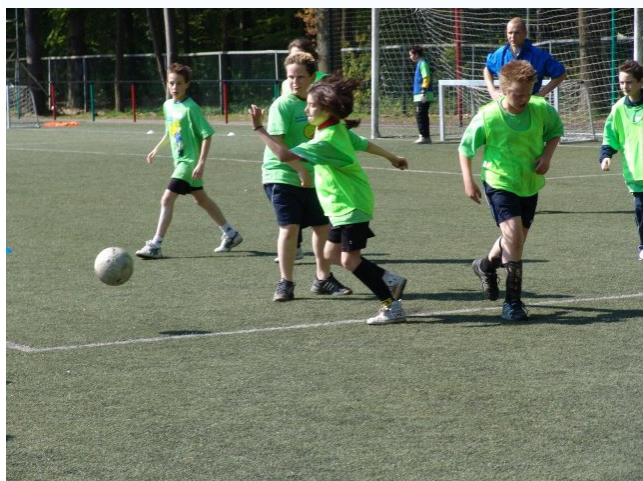
Scoren voor Gezondheid