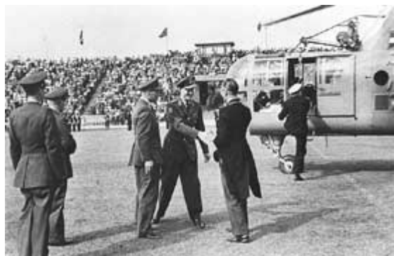
De bouw van de oude goffert: Allemaal met de hand. In 1939 werd de oude Goffert geopend door z.k.h Prins Bernhart

In datzelfde jaar werd iets zuidelijker in de stad het gigantische stadion De Goffert geopend. In grootte destijds het derde stadion van Nederland, na De Kuip en het Olympisch stadion in Amsterdam. De Goffert was gebouwd als onderdeel van het gelijknamige stadspark. Duizenden Nijmeegse werklozen hadden tijdens de crisisjaren min of meer verplicht moeten ploeteren in het park, en zij vervloekten vooral het stadion. 'De Bloedkuul' was de bijnaam. Geen wonder, want De Goffert werd volledig met de hand uitgegraven. Een kuil van zes meter diep, hellingen van negen meter hoog. In totaal werd 80.000 kubieke meter grond verplaatst.