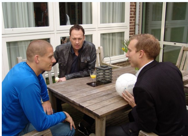
Opening Ronald McDonaldhuis Nijmegen

Van de diverse projecten is de N.E.C. BuurtBattle de bekendste. Stichting Wij staan voor de Wijk ontving voor dit project 'de groene bal' van minister-president Jan Peter Balkenende. Met dit project kunnen verschillende teams uit verschillende wijken in Nijmegen punten verdienen met een zaalvoetbaltoernooi, maar ook zijn er punten te verdienen als zij zich positief inzetten voor hun wijk. Hiervoor kunnen ze bijvoorbeeld winkelwagentjes terugbrengen naar een supermarkt, onkruid wieden in plantsoenen of een schoonmaakactie houden in bussen of in de straten waar ze wonen.