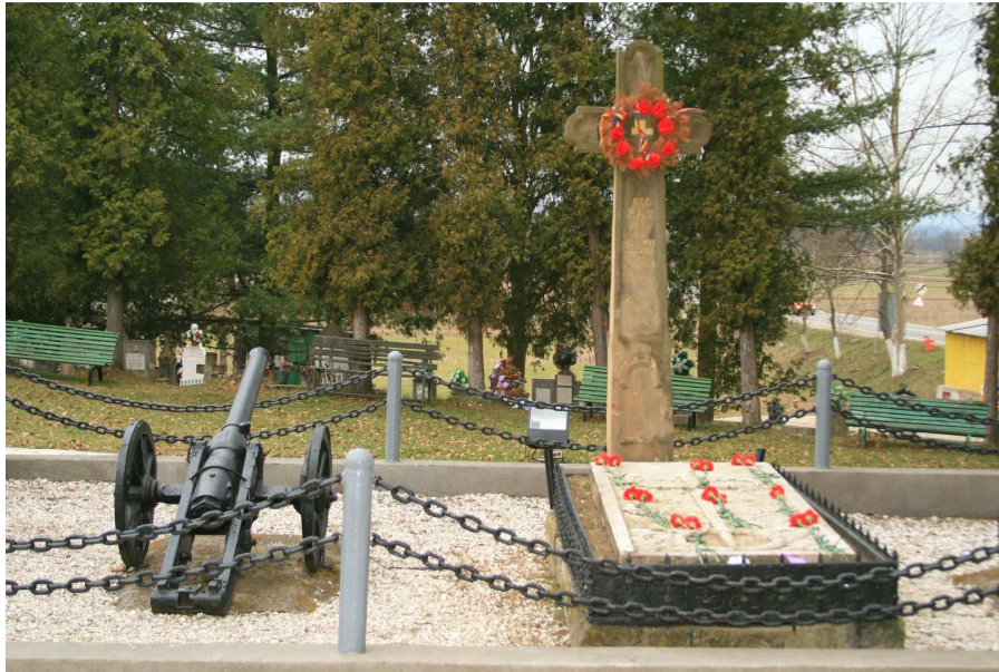
Mormântul lui Avram Iancu, la Tebea