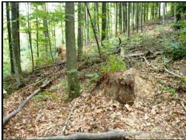
O buturugă proaspătă, tot ce a mai rămas dintr-un falnic fag