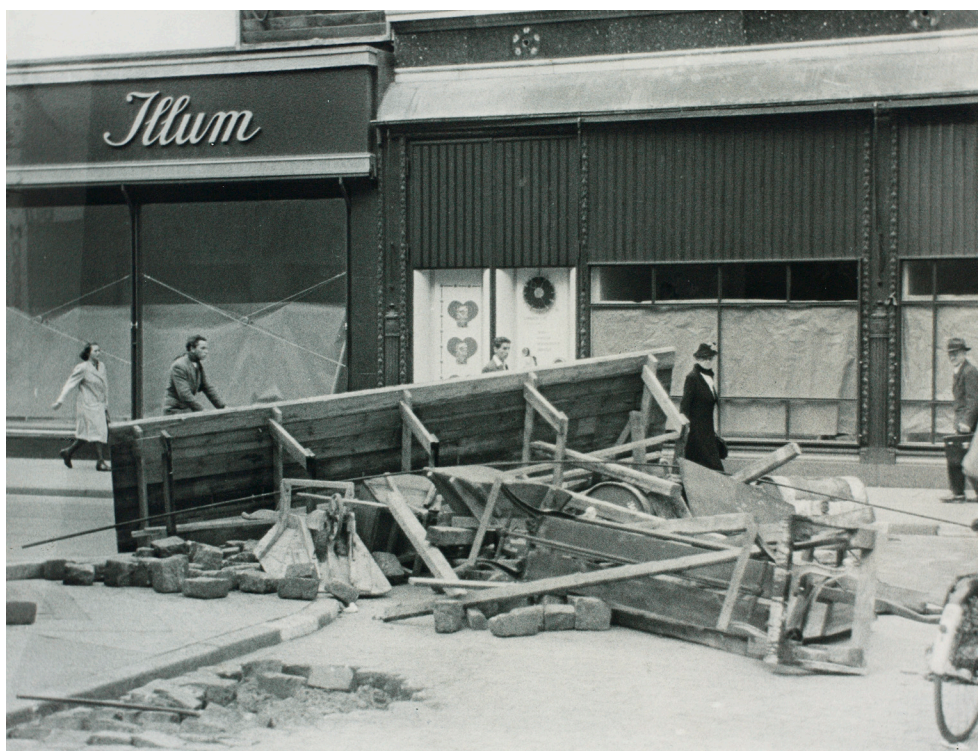
Barrikader på Strøget i Köpenhamn under Folkestrejken i juni 1944 för att hindra tyska patruller att komma fram.

ut lite varstans i gatukorsningarna. Försök att trotsa utgångsförbudet gjordes ändå av demonstranter. Tyska patruller öppnade eld. Nästan 1 000 köpenhamnare miste livet och ca 200 sårade fördes till sjukhus. Köpenhamn var på gränsen till öppet uppror.