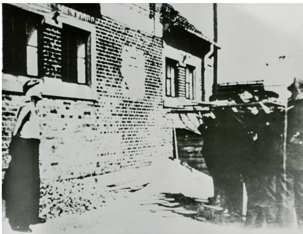
Tysk exekutionspatrull avrättar en dansk patriot.

använde 100-tals kg trotyl för att ödelägga målen. Det var vad som skedde den 6 juni 1944 med Globusfabriken i Glostrup .