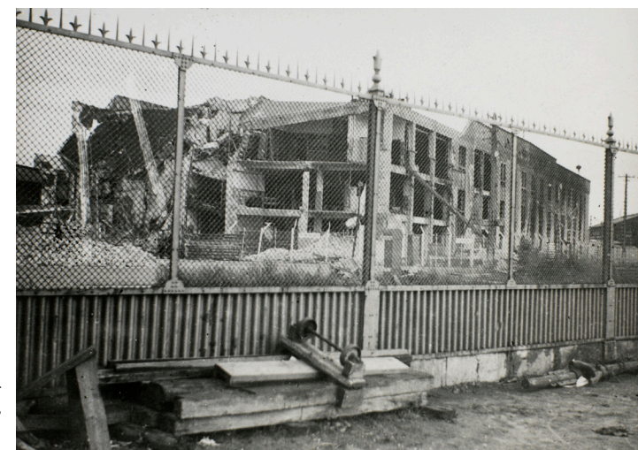
Riffelsyndikatet efter Bopas omfattande sabotage den 22 juni 1944.

För att vilseleda tyskarna om var invasionen skulle äga rum beordrade SOE på försommaren 1944 sabotage och störningsaktioner lite varstans i de ockuperade länderna, bl a i Danmark. Samma dag som invasionen i Normandie började utförde den kommunistiska BOPA en av de mest uppmärksammade sabotageaktionerna i Danmark under hela ockupationstiden. Målet var fabriken Globus, som tillverkade delar till flygmaskiner för bl a tysk räkning. Den låg i Glostrup på vägen mellan Köpenhamn och Roskilde. Vid den här tiden rörde det sig inte längre om sabotagegrupper på några få man, som nattetid smög sig till att placera ut några brandbomber vid någon obebakad anläggning, utan om stora grupper av sabotörer på upp emot ett par hundra man, som med täcktrupper i området kring sabotagemålet i dagsljus med vapenmakt övermannade sabotagevakterna och sedan