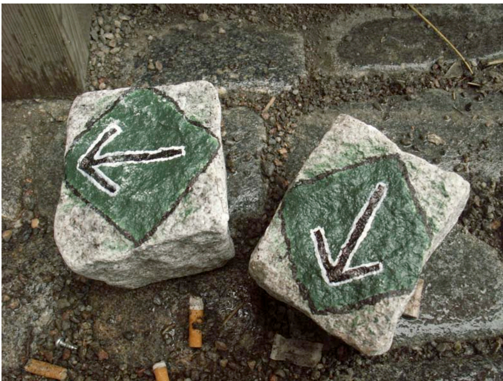
Gatstenar märkta med Svenska Motståndsrörelsens symbol Odalrunan, använda vid attentat

med i termer av ett krig. Propagandan och ideologin har också funktionen av att hålla samman och organisera nazister och rasister och idag utgör den homofobiska propagandan en stor andel av ideologin. Det förakt för demokratin som samlar de nazistiska och rasistiska rörelserna, tillsammans med den starka homofobin, lägger grunden till grova hatbrott, såsom misshandel och mordbrand. Under de senare åren har vi sett en ökning av hatbrotten, både mot individer och i form av skadegörelse och trakasserier mot hbt-relaterade föreningar och klubbar. RFSL är särskilt utsatt. Syftet med hatbrotten är både att skada och skrämja hbt-personer, men också att genom handling sluta de nazistiska och rasistiska leden. För de nazistiska och rasistiska grupperna handlar det som sagt om ett krig.