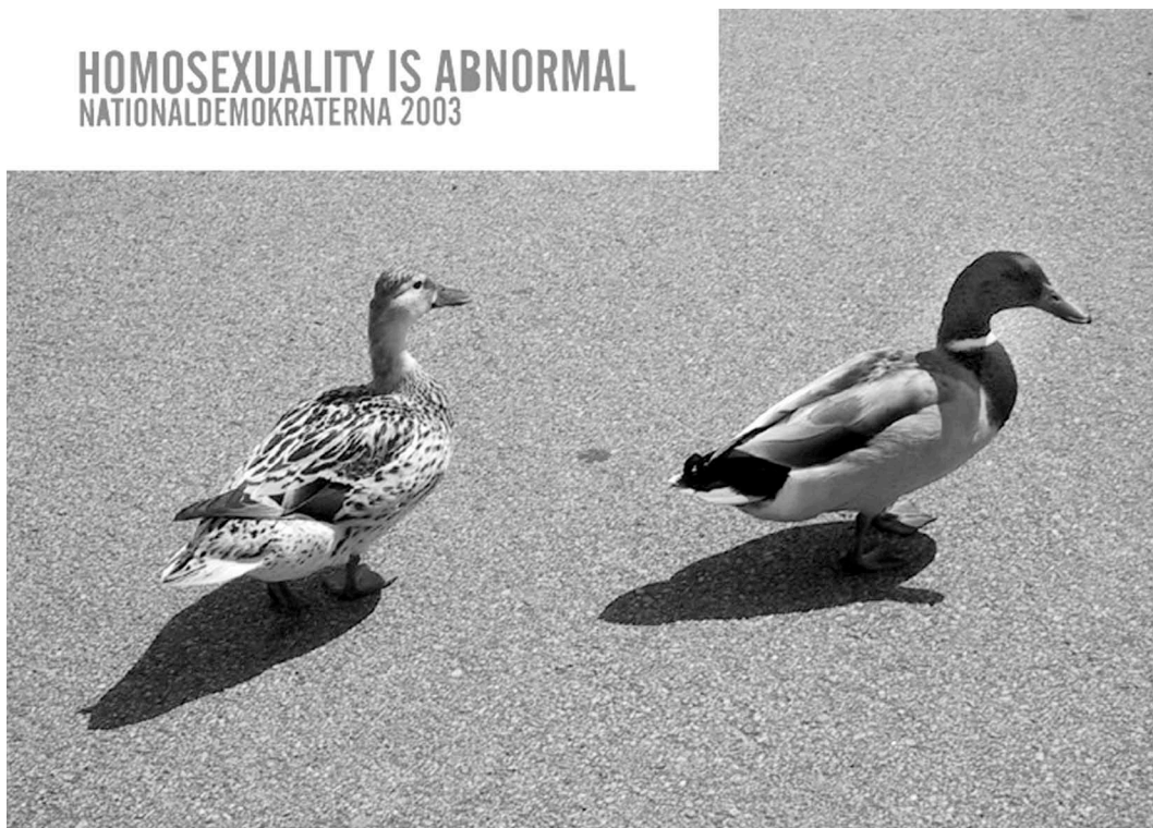
Propagandabild från ND

Idén om den vita rasens övermakt är grunden i nazistisk och rasistisk ideologi. Idag undviker dock många grupper att använda explicit rasideologi. Budskapet ramas in i termer av ”svenskar”, en grupp som ska förstås som de vita invånare i Sverige vars släktband är knutna till den geografiska platsen Sverige (eller åtminstone Norden). Till denna grupp kopplas också ett specifikt, nationalromantiskt kulturarv som innefattar bland annat normen om den heterosexuella kärnfamiljen. Kärnfamiljen beskrivs som själva grunden gruppen svenskar står på och som en bas i nazistisk och rasistisk kamp. Män och kvinnor ges i propagandan mycket traditionella könsroller som bygger på en kvinnlig underordning.