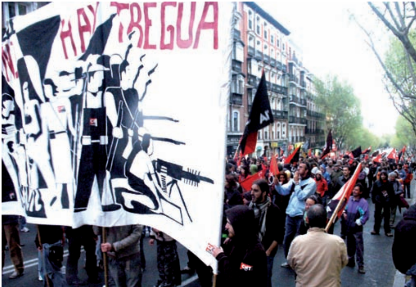
Manifestación contra crisis convocada por CNT el pasado 28 de marzo