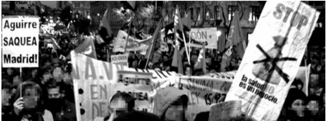
Instante de la manifestación contra la privatización de la Sanidad en Madrid.

Poco antes del comienzo, un nutrido grupo de cenetistas se congregó en Tirso de Molina para acompañar a la representación de la