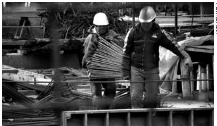
En el 2012 los trabajadores de la construcción estarán obligados a tener una tarjeta profesional.

1. El impreso de solicitud de la tarjeta, debidamente cumplimentado. 2. Una fotografía reciente en tamaño carné. 3. Una fotocopia del DNI o de la tarjeta de residencia. 4. El informe de la vida laboral emitido por la Tesorería General de la Seguridad Social, dentro de los treinta días inmediatamente anteriores a la fecha de la solicitud. Dicho informe puede obtenerse en las Administraciones de la Seguridad Social. 5. Original o fotocopia compulsada del diploma o certificado en el que se acredite que el solicitante ha recibido, como mínimo, la formación inicial en materia de prevención de riesgos laborales. 6. Al menos 1 de los siguientes documentos: a) Certificado de empresa para la Fundación Laboral de la Construcción, expedido de acuerdo con el modelo que figura en el Anexo VI del Convenio General del Sector de la Construc-