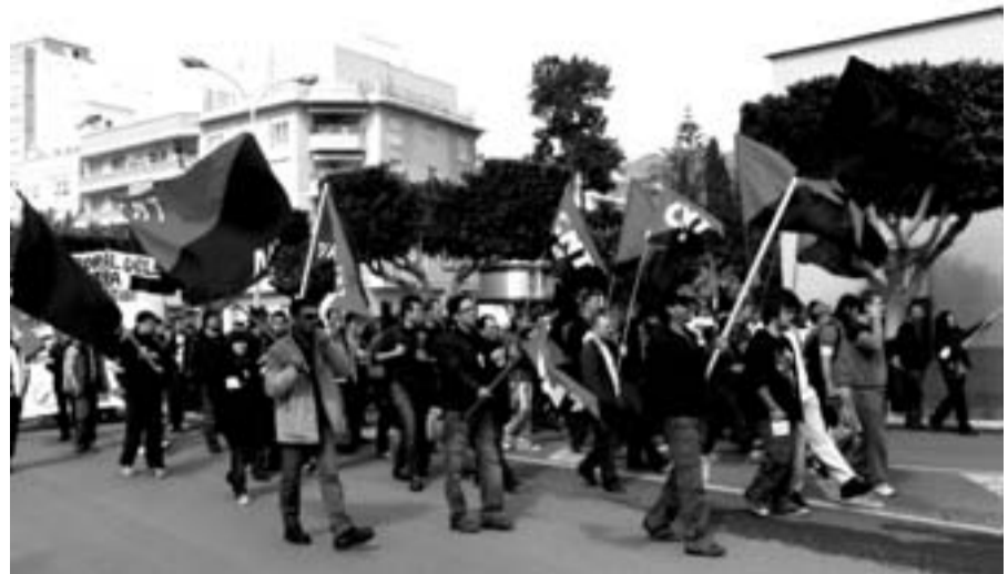
Cabecera de la manifestación contra la crisis el 28 de marzo den Madrid

Durante todo el trayecto, los compañeros y compañeras corearon consignas a favor de la movilización obrera y la lucha sindical, como medio para combatir la eliminación de puestos de trabajo que está trayendo consigo la actual crisis económica del capitalismo. Tampoco faltaron gritos contra la política de destrucción de empleo público que está llevando a cabo el gobierno municipal de la alcaldesa popular Carmen Crespo y se animó particularmente a los compañeros que mantienen conflictos con el Ayuntamiento abderitano: las trabajadoras de la emisora municipal despedidas y los compañeros del mantenimiento de parques y jardines que también perdieron sus empleos. No faltó la denuncia de la pésima gestión que