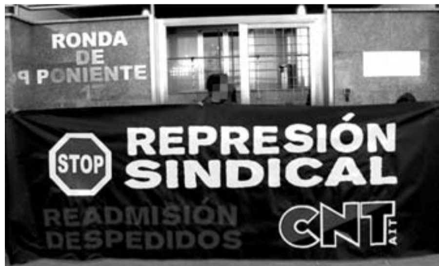
Protesta ante la sede de la empresa PANDA/ CNT MADRID

La conocida empresa PANDA SECURITY, dedicada a fabricar aplicaciones informáticas antivirus, ha despedido recientemente al Delegado de la Sección Sindical de CNT.