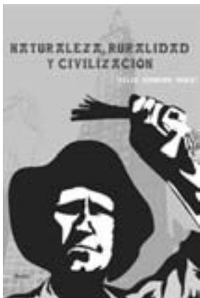
*Autor de Naturaleza, ruralidad y civilización . Editorial Brulot, Madrid, 2008. Contacto: esfyserv@gmail.com

Pero la función del Estado es política: manda sobre la sociedad, la gobierna. Nunca se explica por qué la sociedad no es apta para gobernarse a sí misma y ha de ser regida por el ente estatal,