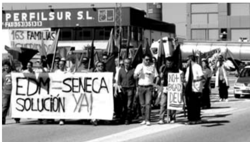
Cabecera de la manifestación

Es por ello que desde el pasado 4 de marzo estos compañeros se encuentran en huelga. Dicho paro está contando con un seguimiento de más del 90% de la plantilla e incluso los trabajadores que estaban de vacaciones y que se tenían que reincorporar a sus