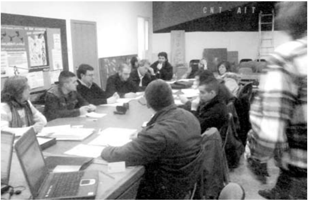
Panorámica de la reunión de la Comisión del Centenario el pasado 28 de febrero en los locales de Tirso de Molina, Madrid

Durante 2007 las páginas de este periódico dieron fe del esfuerzo, sobre todo de las Regionales de Cataluña-Baleares y Extremadura con el apoyo del Comité Nacional, por estudiar y difundir el germen que daría lugar a la CNT. Nos referimos a los centenarios del periódico Solidaridad Obrera, y la organización obrera homónima barcelonesa, y de la Federación Regional Extremeña de Sociedades Extremeñas (FRESO). Libros, exposiciones y jornadas de estudio sirvieron para arrojar