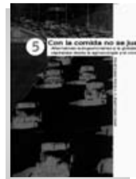
Trajicantes de Sueños Madrid, 2003 246 págs.

Con la comida no se juega. Alternativas autogestionarias a la globalización capitalista desde la agroecología y el consumo.