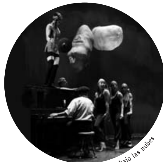
Rain: Cantando bajo las nubes

..... John Locke, el filósofo de la libertad, era accionista de la Royal Africa Company, que compraba y vendía esclavos. Mientras nacía el siglo dieciocho, el primero de los borbones, Felipe V, estrenó su trono firmando un contrato con su primo, el rey de Francia, para que la Compagnie de Guinée vendiera negros en América. Cada monarca llevaba un 25 por ciento de las ganancias. Nombres de algunos navíos negreros: Voltaire, Rousseau, Jesús, Esperanza, Igualdad, Amistad. Dos de los Padres Fundadores de los Estados Unidos se desva-