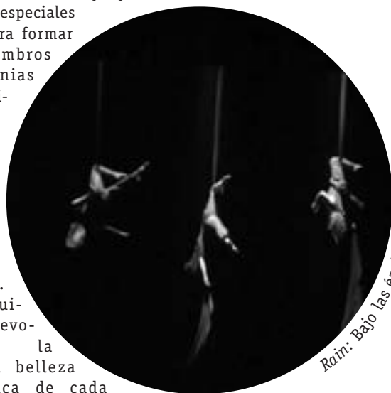
Rain: Bajo las éloizes