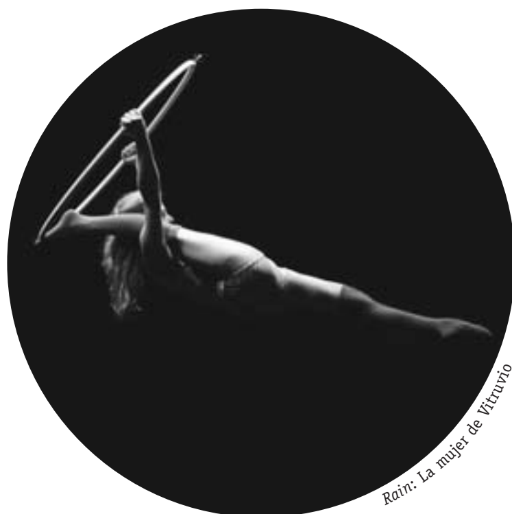
Rain: La mujer de Vitruvio

Por estas tierras sabemos que Francia no sabe vivir sin "les petits espagnols". ¡Qué sería de su cultura, de su política, hasta de su mala conciencia sin este lado de los Pirineos! Las vanguardias, el Frente Popular, la Guerra de España, la Dictadura de Franco, mayo del 68 son tan españoles como... franceses. Así que no extraña la recíproca tradicional amistad entre sus estados y gentes. Dicho sea sin "rin-tin-tín" y sin que se olviden los dispares caminos que han tomado