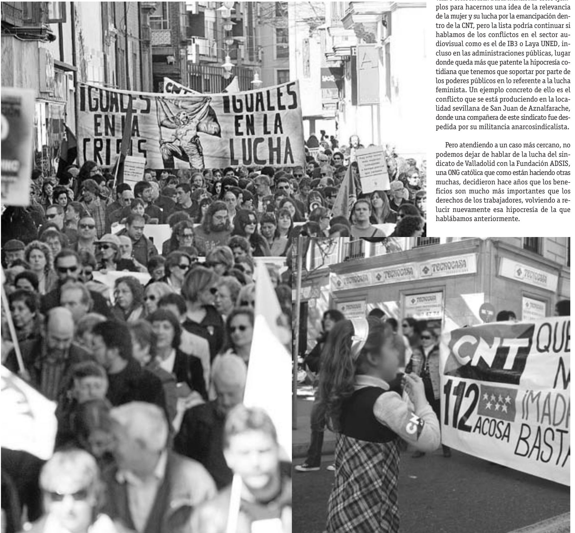
Pancarta de CNT Villaverde durante la manifestación del 8 de marzo en Madrid recordando su conflicto con el servicio de emergencias Madrid 112/CNT Valladolid.

Pero atendiendo a un caso más cercano, no podemos dejar de hablar de la lucha del sindicato de Valladolid con la Fundación ADSIS, una ONG católica que como están haciendo otras muchas, decidieron hace años que los beneficios son mucho más importantes que los derechos de los trabajadores, volviendo a relucir nuevamente esa hipocresía de la que hablábamos anteriormente.