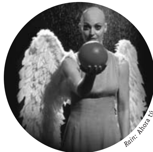
Rain: Ahora tú

N.B.: Si quieres colaborar con la sección teatral de este periódico comentando algún montaje o hablando del panorama teatral en tu ciudad, no dudes en enviar tus textos a la redacción del CNT.