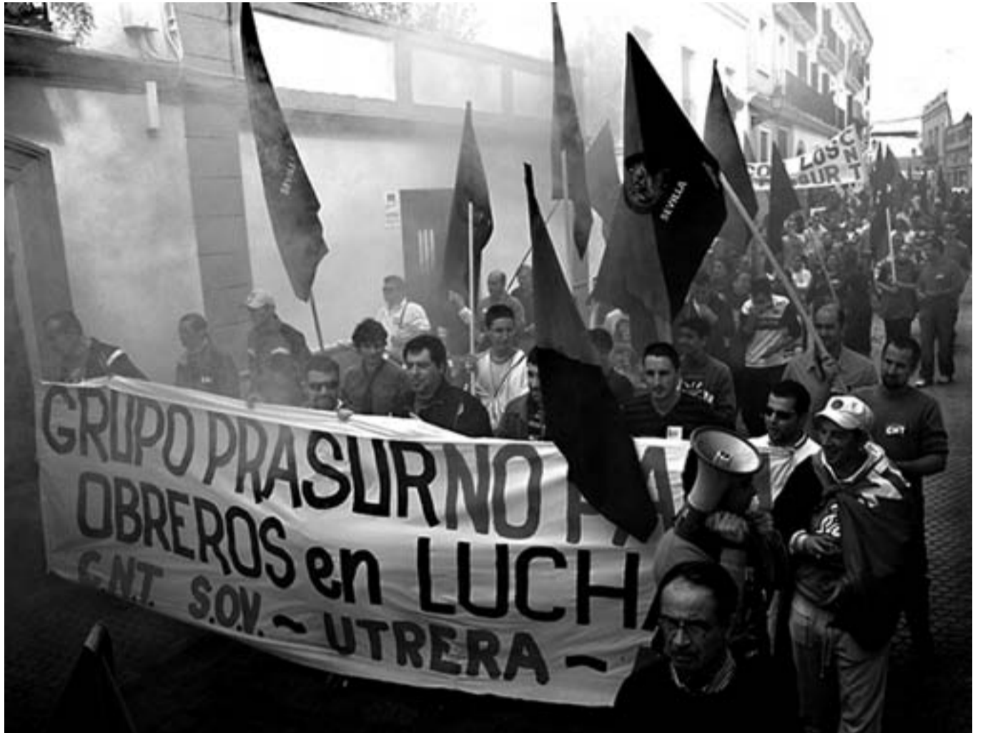
Manifestantes acercándose al Ayuntamiento el 7 de marzo

Pero tras aquella farsa mediática, la bestia movía los hilos para intentar mantener su