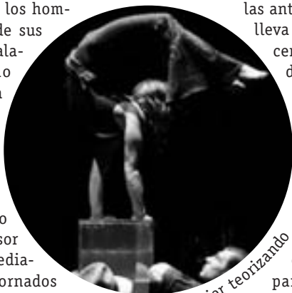
Rain: Mujer teorizando