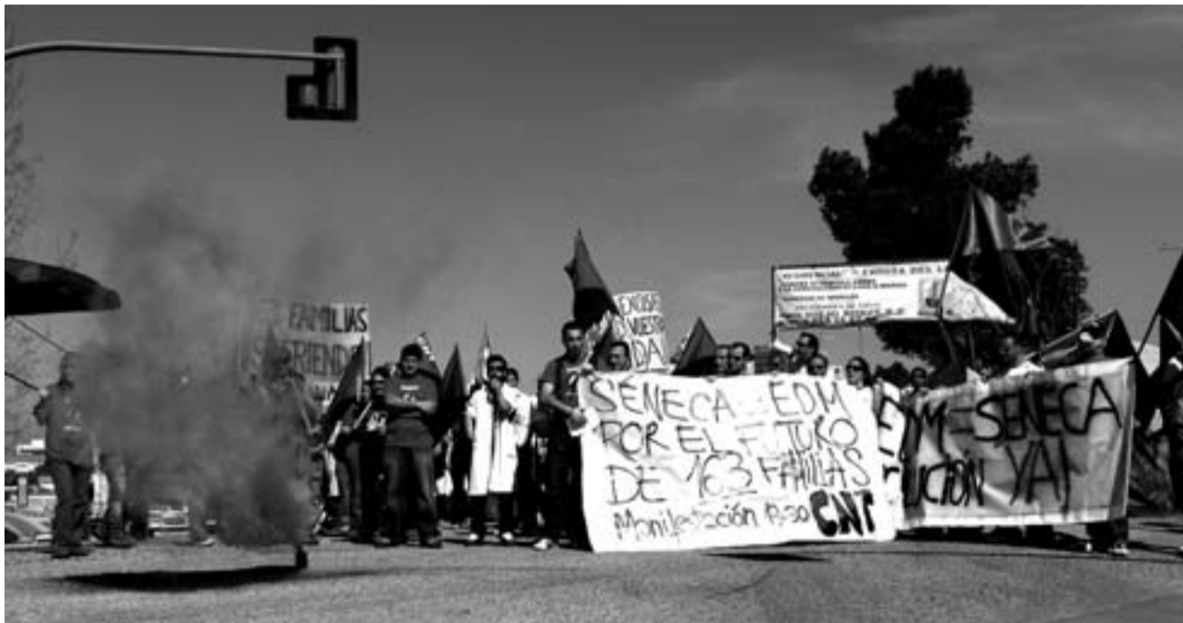
Instantes de la manifestación del pasado 21 de marzo en Mancha Real / CNT JAÉN