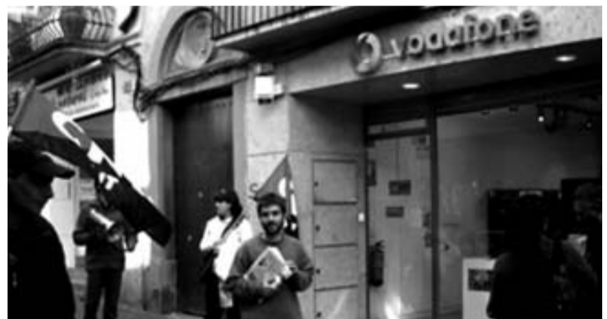
Concentración del 13 de marzo ante Marc Operator/ CNT TERRASSA

sindical bilbaína desean denunciar las prácticas antiobreras de las que impunemente hace gala la empresa PANDA SECURITY: despidos fulminantes, masivos y periódicos; subcontratación a través de ETT's, con objeto de "filtrar" a los trabajadores y librarse de pagar los complementos por antigüedad correspondientes; precariedad y salarios de miseria; ninguneo de Convenios Colectivos y derechos laborales; y por último y sobre todo, represión sindical. Es por todo ello que los compañeros nos invitan a movilizarnos contra PANDA SECURITY allá donde ésta explota y reprime a sus trabajadores.