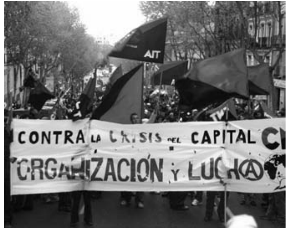
Cabecera de la manifestación contra la crisis el 28 de marzo en Madrid

En contraposición, presenta el modelo de la CNT: revolucionario y emergente. La primera huelga general contra la crisis la ha convocado la CNT en Lebrija (Sevilla). El pasado 18 de febrero un 90% del pueblo paró por un reparto justo del trabajo ( ver periódico cnt 354 ). Días después, los trabajadores de PRASUR (Utrera, Sevilla), que sufren impagos de meses, revocaron al Comité de Empresa y se pasaron en masa a la CNT. En Séneca-EDM de Jaén, están en huelga, mayormente promovida por la CNT, desde el pa-