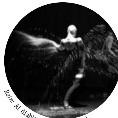
Rain: Al diablo con las pelucas!