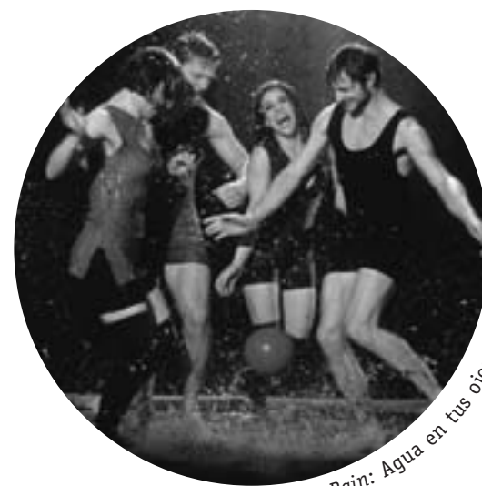
Rain: Agua en tus ojos

Además, traza un análisis discursivo que examina, pero también diferencia, la aparición de la agitación armada y el terrorismo.