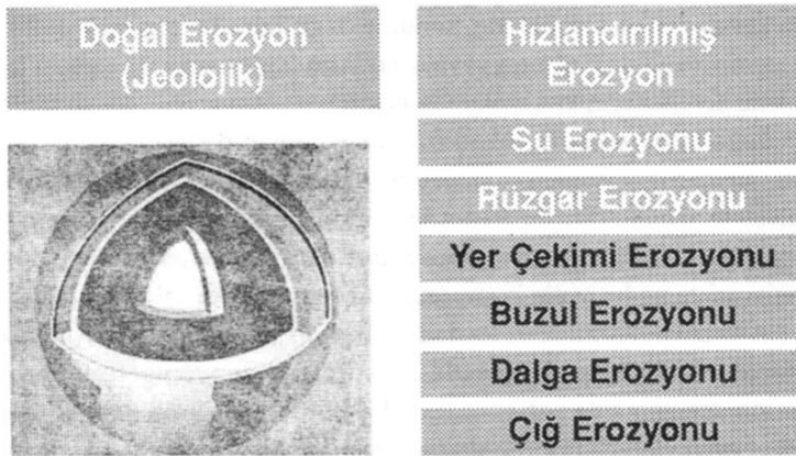
Şekil 4.2: Oluşumuna ve Etkenlerine Göre Erozyon Çeşitleri

Yukarıdaki bu tanım kapsamındaki erozyon, dünya varolduğundan itibaren başlamış ve bugün de devam etmekte olan bir olaydır. İnsanın yeryüzündeki faaliyetlerine başlamasına kadarki devirlerde doğal bir süreç ve olay olan erozyon, insanların doğayı ve toprakları kullanmaya başlamasından sonra bu doğal süreç özelliğini kaybetmiş ve farklı bir boyut kazanmıştır. Bu nedenle erozyon, bu iki farklı süreç için ayrı ayrı ele alınarak incelenebilir. Erozyon olgusundaki bu iki süreçten ilki "doğal erozyon", ikincisi ise "hızlandırılmış erozyon" dur (Şekil 4.2).