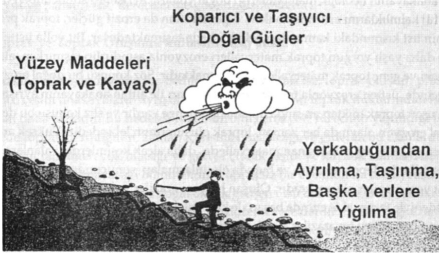
Şekil 4.1: Erozyon ve Erozyonun Oluşumu

Erozyon, başta toprak ve kayaç materyalleri olmak üzere yer küre üzerindeki çeşitli yüzey maddelerinin dağlık ve tepelik arazilerden eğimler boyunca, yer kabuğundan ayrılması ve doğal etkenlerle başka bölgelere taşınması olayıdır (Şekil 4.1).