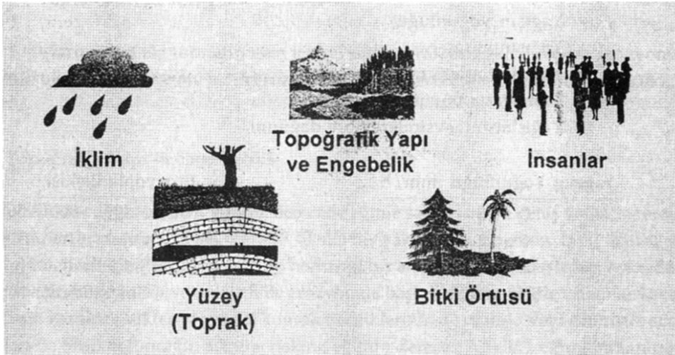
Şekil 4.4: Erozyonun Oluşumuna Etki Eden Faktörler

Toprak erozyonunun oluşumuna etkide bulunan etmenler, genel bir yaklaşımla doğal etmenler ve insandan kaynaklanan etmenler olmak üzere iki ana grup altında incelenebilir. Doğal etmenler içerisinde; iklim özellikleri, toprak özellikleri, topoğrafik yapı ve engebelik ile bitki örtüsünün özellikleri yer almaktadır (Şekil 4.4). İnsanlardan kaynaklanan etmenler ise sosyo-ekonomik etmenler olup; arazilerin yeteneklerine uygun bir şekilde kullanılmaması, yanlış toprak işleme, geniş alanlarda hatalı nadas uygulamalarının yapılması, uygun bir bitki münavebesinin yeterince uygulanmaması, ormanların tahrip edilmesi ve orman arazisi nitelikli (böyle alanların üzerinde bir tek ağaç dahi bulunmasa teknik anlamda orman arazidir) arazilerin tarım arazileri haline dönüştürülmesi, çayır-meraların düzensiz, kontrolsüz ve ağır bir biçimde otlatılması ve özellikle tarım arazilerinde gerekli toprak muhafaza tedbirlerinin yeterince alınmaması gibi nedenlerdir. Özellikle insandan kaynaklanan etmenler, erozyona neden olan doğal etmenlerin toprakları tahrip etme hızını ve gücünü arttırması bakımından son derece önemlidir.