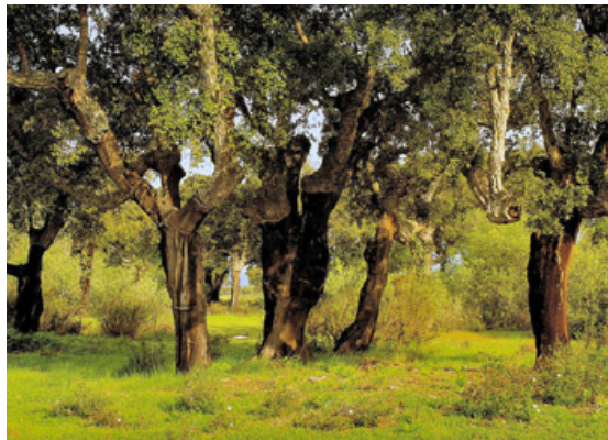
Alcornocales en "El Retín" (Cádiz).

Asimismo, colaboran también la Asociación para el Desarrollo Rural de la Janda Litoral y la Sociedad Gaditana de Historia Natural.