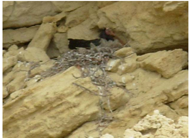
Primera pareja de Ibis eremita que se reproduce en libertad

En Junio de 2004, y a partir del segundo año de vida, se están realizando sueltas controladas de ejemplares para comprobar la efectividad de los métodos utilizados. Se espera que a partir del cuarto año de vida, los ejemplares adultos se reproduzcan libremente en esta comarca.