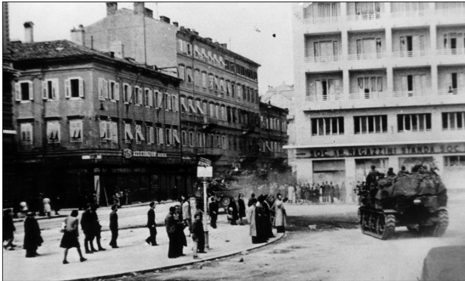
3 maggio 1945. I blindati dell'Armata Popolare jugoslava nel centro di Fiume. 3. svibanj 1945.. Oklopna kola Jugoslavenske narodne armije u centru Rijeke.