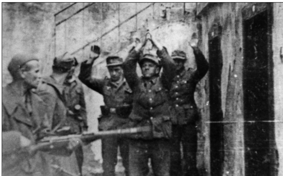
Fiume, maggio 1945. Gli ultimi soldati tedeschi si arrendono ai partigiani. Rijeka, svibanj 1945.. Njemački vojnici predaju se partizanima.