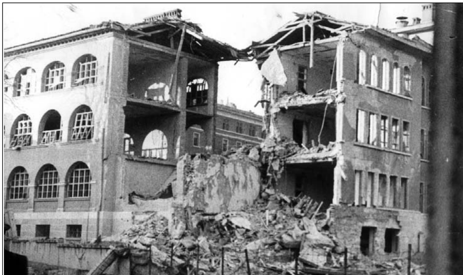
Fiume, 1944. La scuola "Daniele Manin", sede del Comando tedesco, centrata dai bombardamenti alleati.