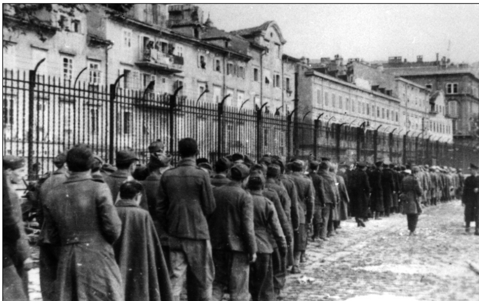
Fiume, maggio 1945. Prigionieri italiani ammassati a Sušak, oltre il vecchio confine italo-jugoslavo. Rijeka, svibanj 1945.. Talijanski zarobljenici kraj Rečine, stara granica između Italije i Jugoslavije.