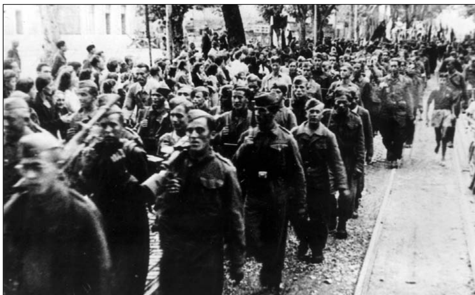
3 maggio 1945. Entrano a Fiume i primi reparti partigiani. 3. svibanj 1945.. Ulazak u Rijeci prvih partizanskih odreda.