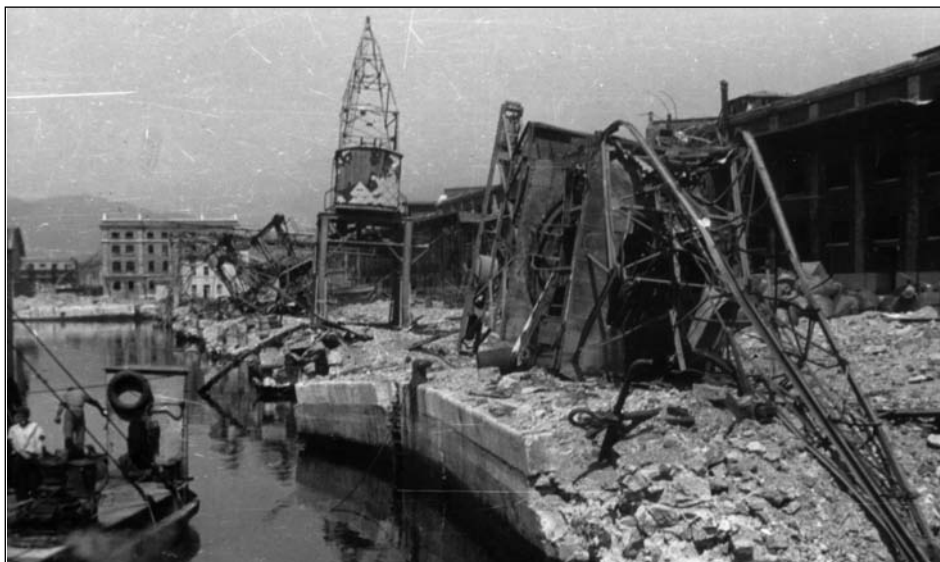
Fiume, 1945. Le attrezzature portuali devastate dalle mine tedesche.