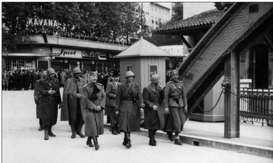
Fiume, aprile 1941. I plenipotenziari dell'esercito jugoslavo varcano da Sussak il ponte sull'Eneo per trattare la resa.

Rijeka, tgr Dante Alighierija, travanj 1941. Odjel mladih fašista i milicije se spremaju prijeći granicu između Italije i Jugoslavije.