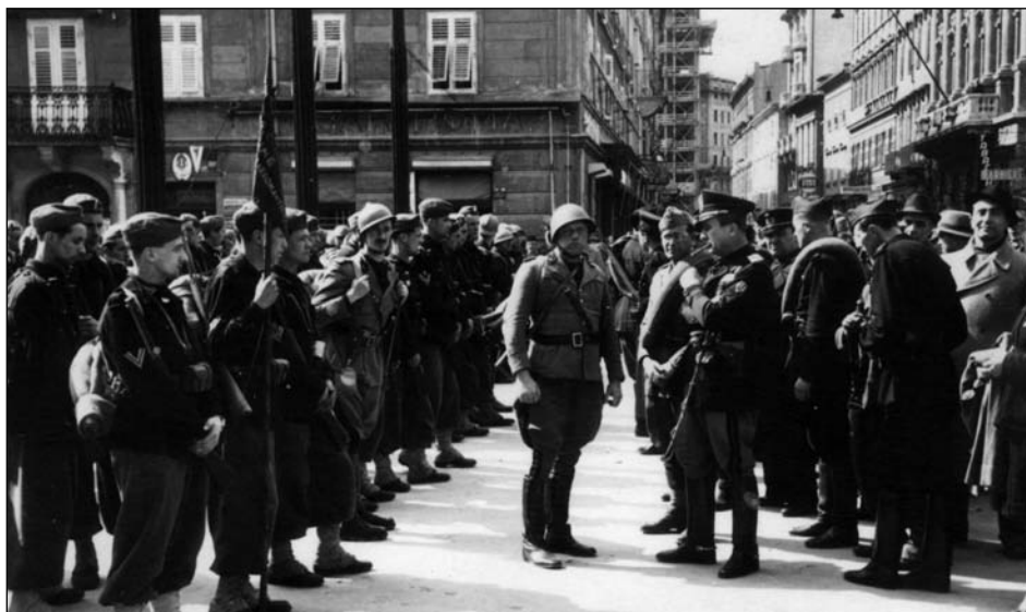
Fiume, Piazza Dante Alighieri, aprile 1941. Reparti di Giovani Fascisti e della Milizia si apprestano a varcare il confine italo-jugoslavo.

Rijeka, tgr Dante Alighierija, travanj 1941. Odjel mladih fašista i milicije se spremaju prijeći granicu između Italije i Jugoslavije.