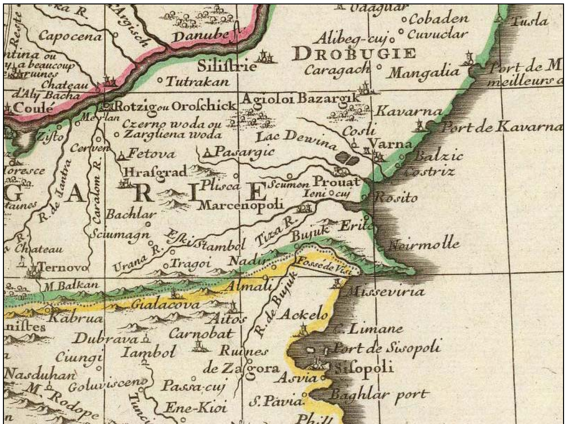
Guillaume De l'Isle. Carte de la Hongrie. 1703.