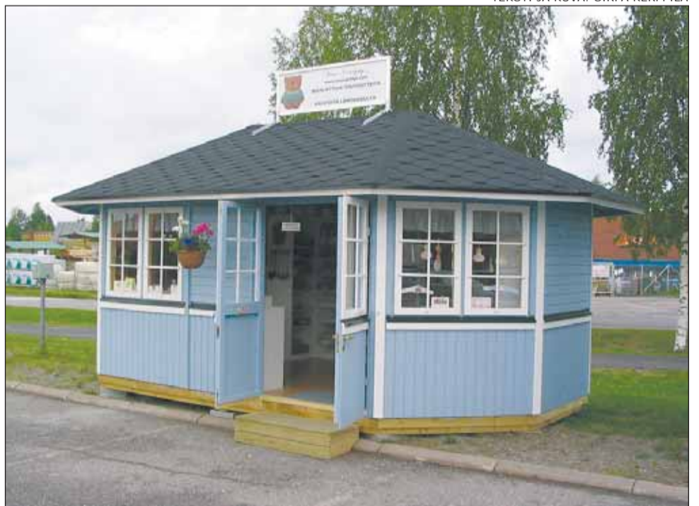
TEKSTI JA KUVA: SIRPA KERPPILÄ

– Minulla on muutamia isoja asiakkaita, tuotanto on kasvussa ja mahdollisesti lisää alihankintaa sekä markkinointia. Koko ajan on kuitenkin uudistuttava, mutta puu säilyy materiaa-