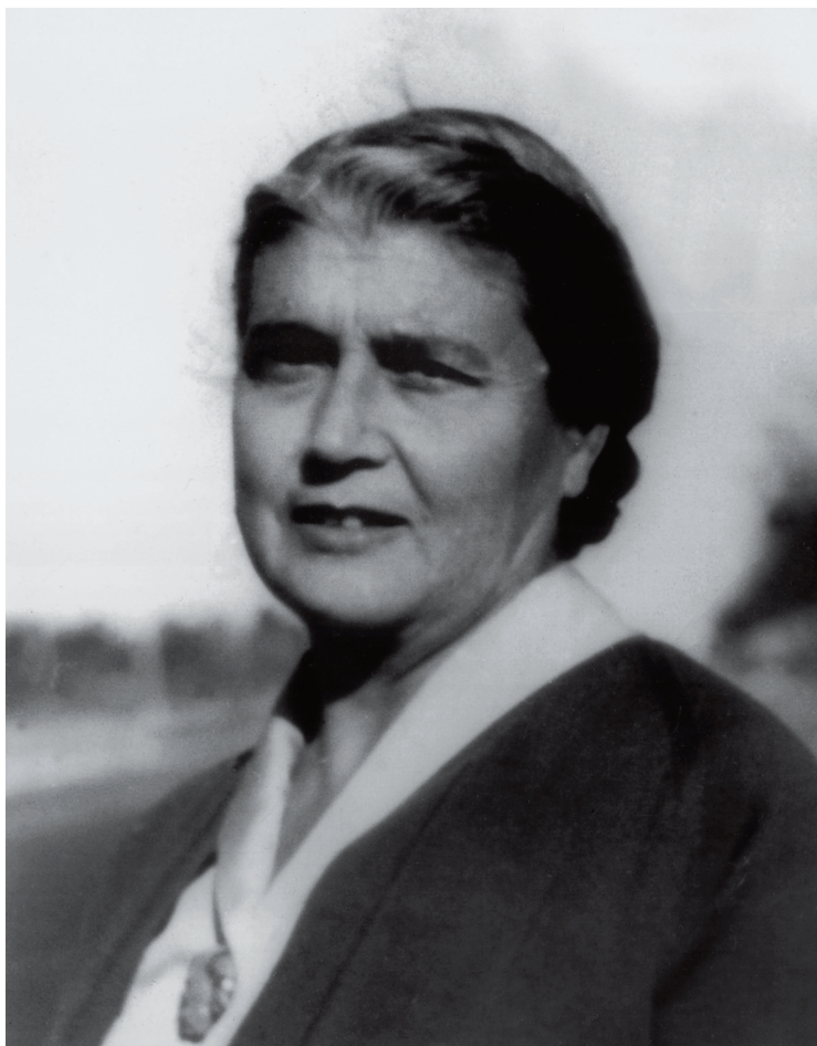
La lexicógrafa María Moliner

Y es consciente de que en algunos casos el catálogo puede resultar «incoherente e incompleto, pero no dejará de ser útil en algunos casos». Su modestia es un valor añadido. Sabe que no es como los dioses que alcanzan los límites del universo léxico. Solo como un astrónomo que observa el firmamento de la lengua y ofrece el fruto de sus anotaciones. ¡Pero qué astrónoma! Su cerebro era como un telescopio que no tenía nada que envidiar al famoso Hubble.