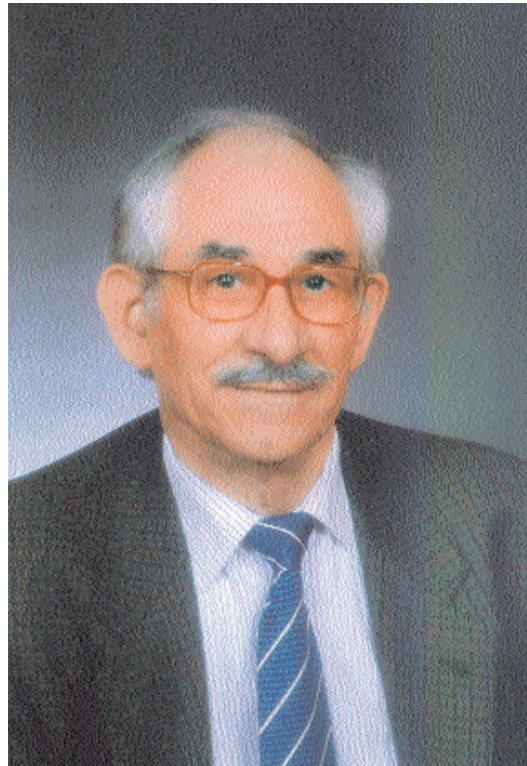
José Martínez de Sousa

Así pues, a la Academia Española, porque así lo quiere el mundo hispánico, corresponde poner orden en las cuestiones del lenguaje, establecer las normas por que ha de regirse no solo la ortografía, que es en lo primero que pensamos cuando de esto se habla, sino también el resto de la gramática y el léxi-