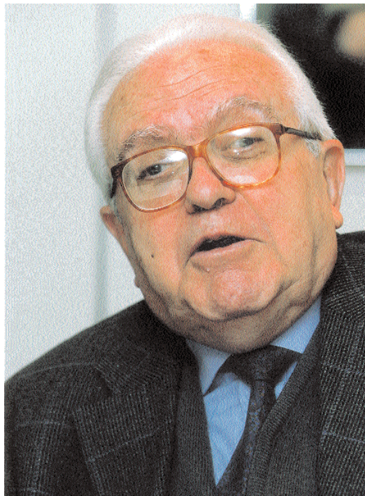
Gregorio Salvador, vicedirector de la RAE

Ciertamente. Para lograr vender una telenovela fuera del país que la produce es preciso que los responsables de ese nuevo producto afinen. Al principio, unas series tenían mucho éxito en su país, pero al traspasar fronteras no obtenían esa misma aceptación. Se había exagerado el costumbrismo. Esto se fue eliminando por razones comerciales, asumiéndose detalles de adaptación lingüística general. Así, las leyes del mercado han actuado positivamente. Los productores de esos programas ya no solo cuidan la lengua, sino que también sopesan los guiones y su desarrollo desde el amplio punto de vista de su comprensión común. Existen, por ejemplo, asesores médicos que supervisan los diálogos en los que