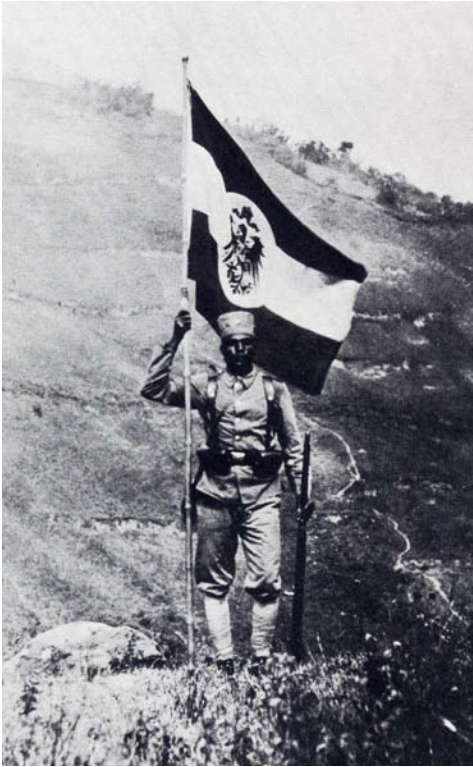
Abb. 4: Askari in Ruanda während der deutschen Kolonialzeit (In: Honke 1990, S. 56).