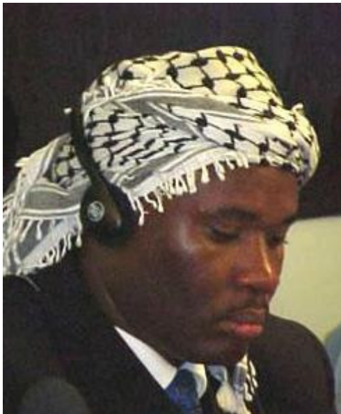
Abb. 6 Hassan Ngeze vor dem Kriegsverbrecher-Tribunal in Asruha.

http://images.google.de/imgres?imgurl=http://www.trial-ch.org/trialwatch/profil_photo.php%3FProfileID%3D107%26Width%3D100&imgrefurl=http://www.trial-ch.org/trialwatch/profiles/fr/facts/p107.html&h=121&w=100&sz=4&tbnid=F-UzKVwjySx6M:&tbnh=83&tbnw=68&hl=de&start=20&prev=/images%3Fq%3DNgeze%26svnum%3D10%26hl%3Dde%26lr%3D