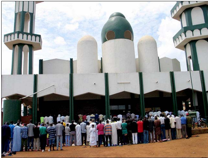
Abb. 1 Betende Muslime vor der Al-Masquit Moschee in Nyamirambo (aus: Lacey 2004).