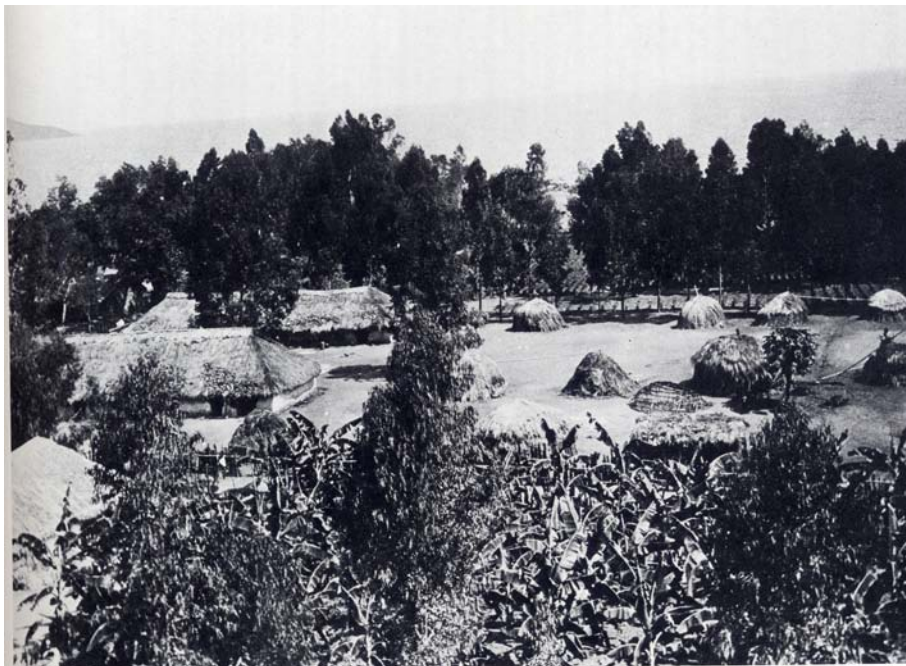
Abb. 2: Erste dauerhafte Niederlassung muslimischer Askari. Deutsches Lager in Gisenyi (aus Honke 1990, S. 57).