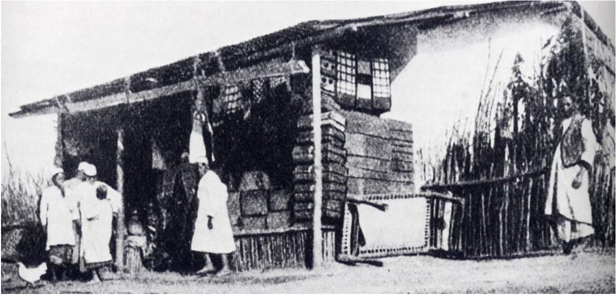
Abb. 3: muslimische Händler in Ruanda zu Beginn des 20. Jahrhunderts (In: Honke 1990, S. 60).