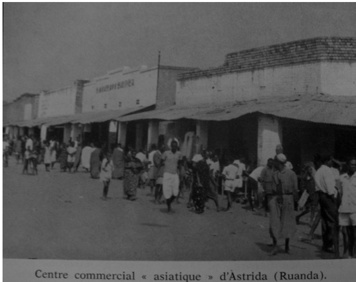
Abb. 5 Muslimisches Viertel in Butare (In: Abel 1960: 56).