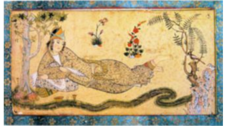
ETIOPISK DRONNING: En variant av dronningen.