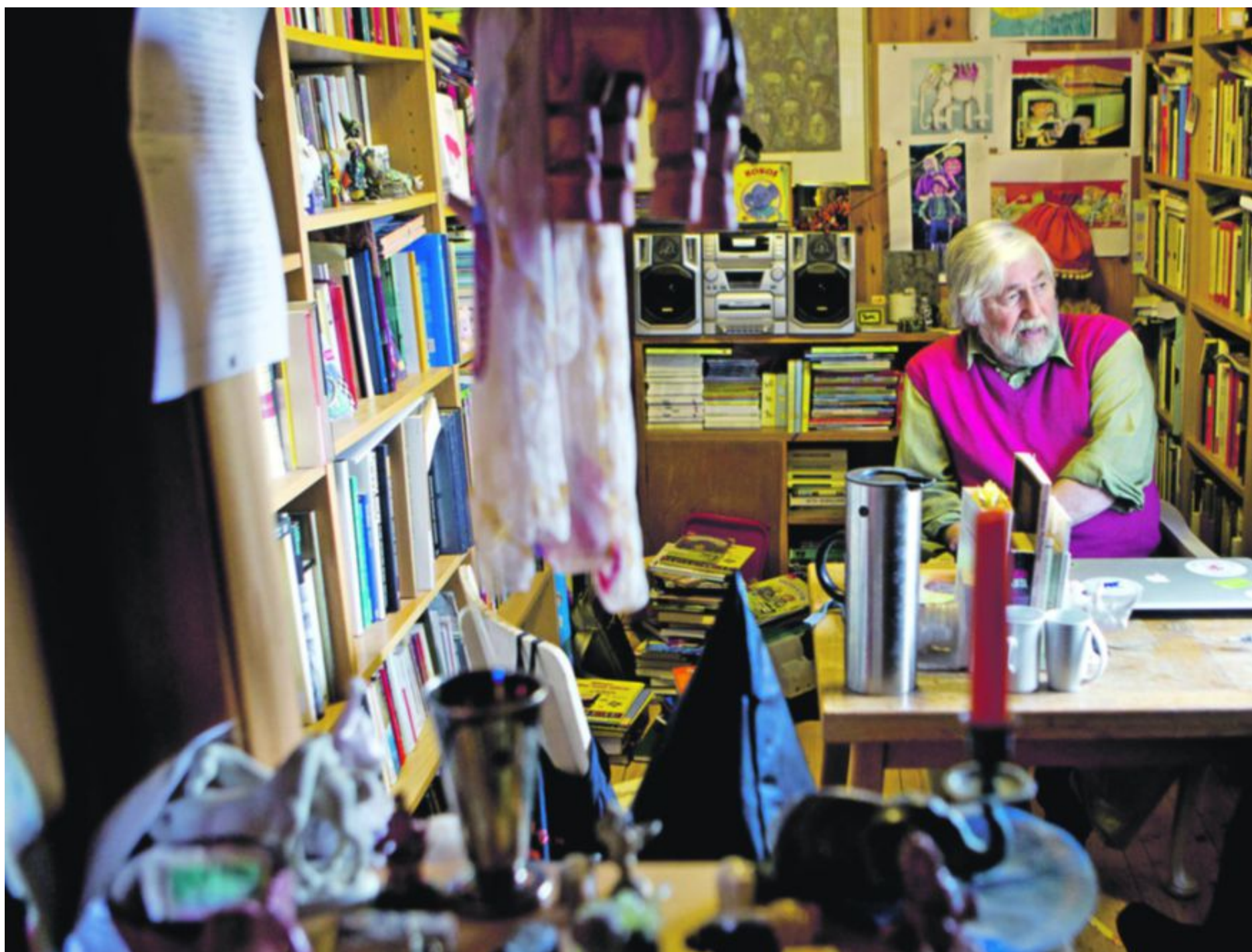
RYDDER INNIMELLOM: – Jeg tar et rask av og til, sier forfatteren om opprydding i sitt skrivehus. Han er en ekte samler, som har vondt for å kaste.