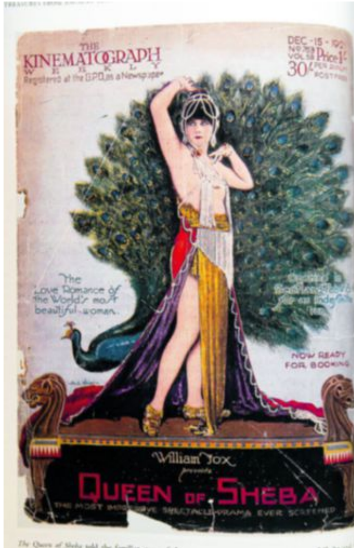
FORSIDEPIKE: Film om dronningen omtalt i filmtidsskrift anno 1921.