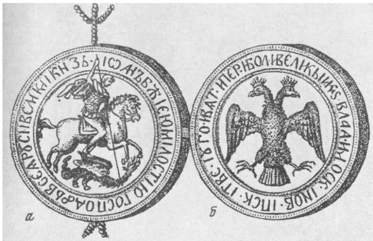
Государственная печать Иоанна III

Символично в этой связи и то, что на Руси двуглавый орел дополнился гербовым изображением всадника (св. Георгия Победоносца), поражающего копьем (или царским скипетром ) змия – носителя зла. Этот образ и почитание св. Георгия привились на Руси сразу после Крещения, в чем можно видеть один из символов России как удерживающего , соответствующий ее самосознанию. С 1497 года св. Георгий, поражающий змия, и двуглавый орел изображались с двух сторон государственной печати Иоанна III.