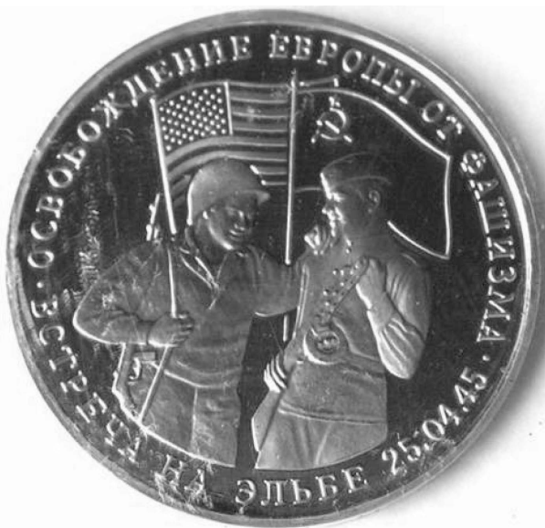
Монета 3 рубля 1995 г. "Освобождение Европы от фашизма. Встреча на Эльбе".

Подлинными победителями в этой войне стала та сила, которая войну инициировала и хорошо понимала ее смысл – в отличие от своих противников. Эта сила давно готовила свой Новый мировой порядок для антихриста, чему послужил и СССР, в том числе созданием государства "Израиль".