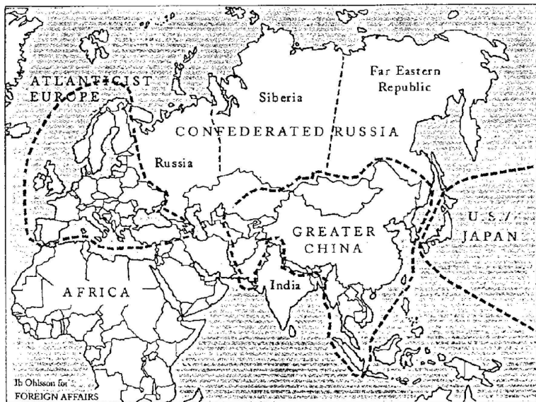
Карта с границами России в журнале Foreign Affairs

Мы уже отмечали, что "Гог и Магог" – это организованное дьяволом ополчение множества народов «с четырех углов земли» против верного Истине «стана святых и города возлюбленного» (Откр. 20:7–8)... Народов "Гога и Магога", которых сатана «выйдет оболщать» на брань против «стана святых» в конце истории, чаще всего европейцы помещали на востоке Азии, оттуда они в прошлом не раз приходили грабить Европу. Сегодня план объединить против православной России все народы «с четырех углов земли», при активной роли Китая, просматривается в книге "Великая шахматная доска" одного из влиятельных стратегов "мировой закулисы" З. Бжезинского с приложением карты в юбилейном (сент.-окт. 1997) номере журнала Foreign Affairs – органа "Совета по международным отношениям".