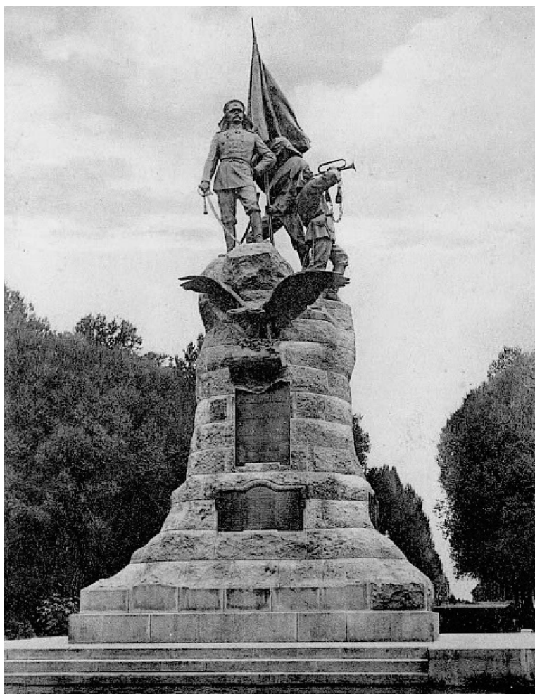
Памятник первому туркестанскому генерал-губернатору Константину Петровичу фон Кауфману и покорителям Средней Азии, открыт в Кауфманском сквере в центре Ташкента в 1913 г., уничтожен большевиками в 1919 г.