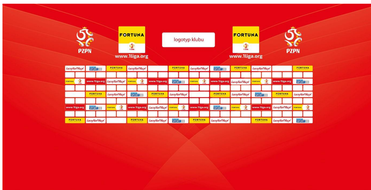
Poglądowa ścianka do sal konferencyjnych na meczach o Mistrzostwo 1. ligi