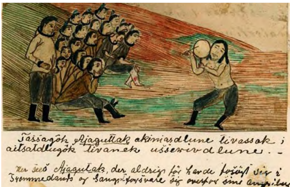
Fig. 8. Ajaguttak cantant una cançó satírica al seu oponent (de peu) a Groenlàndia. Dibuix realitzat per Jens Kreutzmann cap el 1860.

Un anys més tard Knud Rasmussen, el 1922, fent referència als paallirmiut, un subgrup dels inuit del Caribú (Canadà) ens relata que “existeixen també cançons