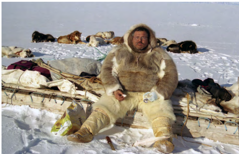
Fig. 4. Caçador inughuit de Qaanaaq (nord-oest de Kalaallit Nunaat). Col·lecció privada Francesc Bailón (2004)