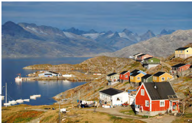
Fig. 2. Poble de Kuummiit, costa est de Kalaallit Nunaat.