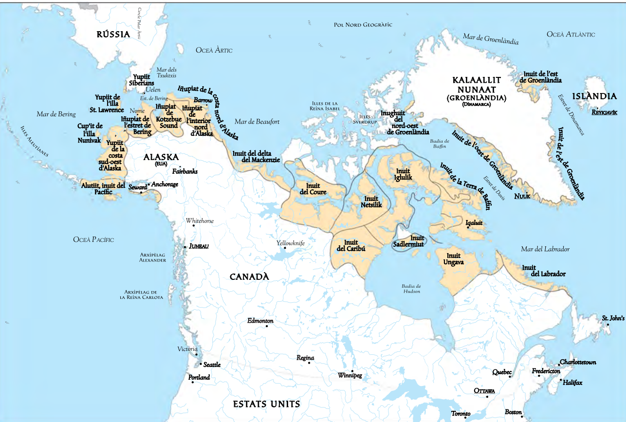
Figura 1. Mapa ètnic dels diferents grups inuit de l'Àrtic. Adaptació del mapa "Key to Tribal Territories", del llibre de David Damas (Editor), Handbook of North American Indians. Arctic , vol. 5, p. IX. Confeccionat per Alicia Pou.