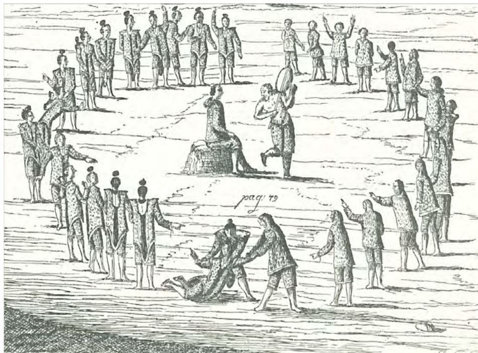
Figura 7. Duel cantat a Groenlàndia (primera meitat del segle XVIII).

Dibuix realitzat per Hans Egede i publicat en el seu llibre Det gamle Grønlands nye perustration, eller Naturel-historie (p. 92). Imprès per Johann Christoph Groth, a Copenhaguen (1741).