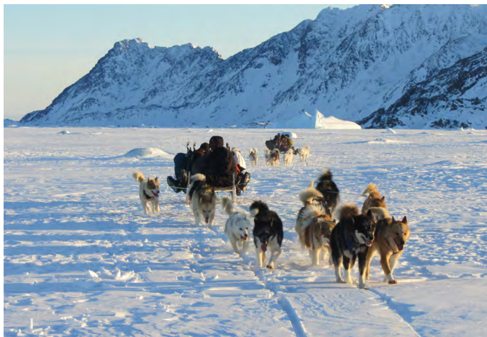
Fig. 5. Caçadors ammassalimiut de la costa est de Kalaallit Nunaat.