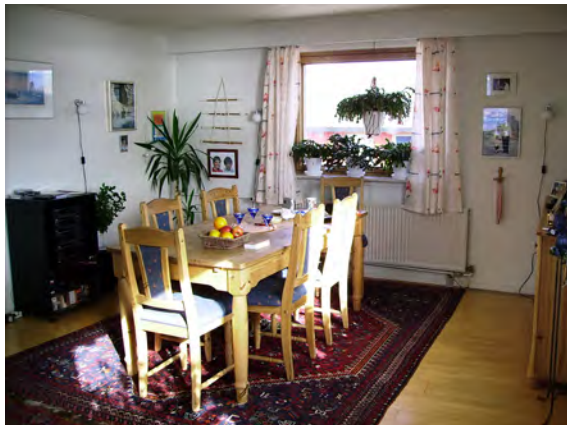
Fig. 3. Menjador d'una família groenlandesa d'Uummanaq.