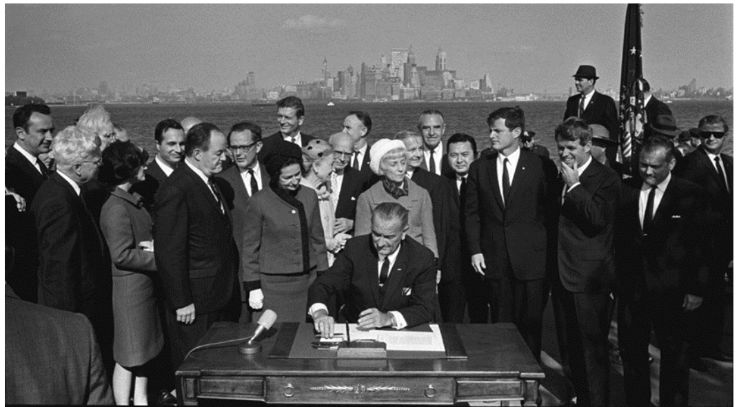
Il giorno più triste della storia degli Stati Uniti. Il presidente Johnson, con 2 Kennedy ed ex presidente Hoover, dà l'America al Messico - 3 ottobre 1965