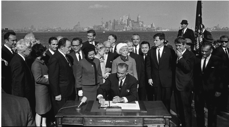
Le jour le plus triste de l'histoire des États-Unis. Le président Johnson, avec 2 Kennedy et l'ex-président Hoover, donne l'Amérique au Mexique - Oct 3rd 1965