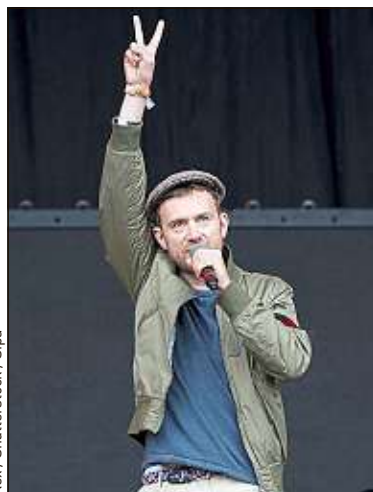
Damon Albarn, le leader de Gorillaz.

Comme Vald, une galaxie d'artistes (Alkpote, Fuzati...) mettent leurs talents pour le second degré au service de la caricature fine de la figure du rappeur. Mais l'incompréhension est souvent au rendez-vous. Sujet à l'autodérision, Disiz a été perçu comme le rappeur gentil. Un portrait qui l'a agacé et valu aux médias des recadrages. Vald est aussi victime de son image. « Certains disent que je suis le Eminem français parce que je suis blond. Je ne peux pas grand-chose pour eux. »