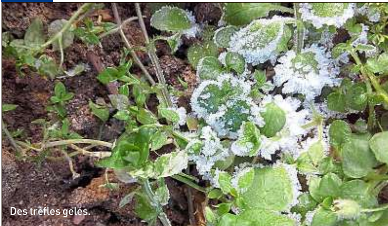
Des trèfles gelés.