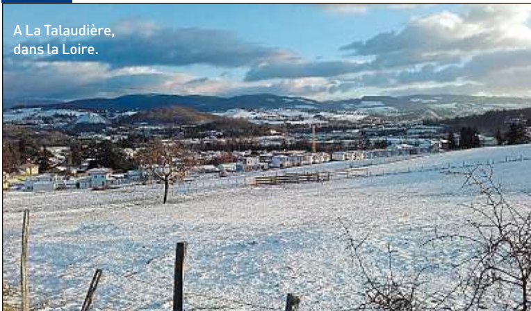
A La Talaudière, dans la Loire.