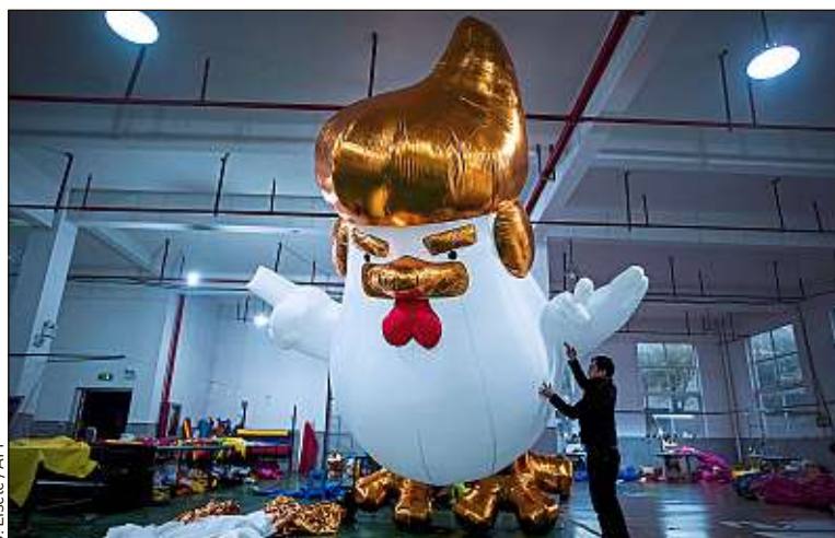
Les Chinois raffolent de cette statue gonflable pour fêter l'année du coq.