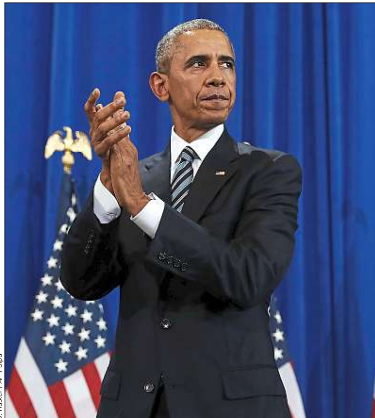
Barack Obama prononce, ce mardi, à Chicago, son discours d'adieu.

► Obamacare, LA grande réforme de sa présidence ? Pour Vincent Michelot, la loi sur l'assurance maladie surnommée Obamacare est « LE texte de sa présidence » qui a permis à 16 à