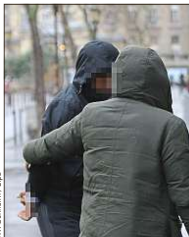
L'un des suspects interpellés dans l'enquête sur le braquage de la star.

Falzon, cofondateur. De même, le patient peut faire une visite virtuelle de l'hôpital, demander un service (la télévision, un taxi), savoir comment se préparer (douche à la Bétadine, médicament à prendre la veille...). C'est surtout un suivi numérique précieux qui est proposé. « Pendant les cinq jours après l'opération, le patient répond à des questionnaires en fonction de sa pathologie et du type d'intervention », reprend le cofondateur. Ainsi, grâce à des algorithmes, une alerte prévient le soignant en cas de souci, qui rappelle le patient. L'objectif, à terme ? Encourager la prise en charge en ambulatoire et ainsi permettre à la Sécurité sociale de faire des économies. ■