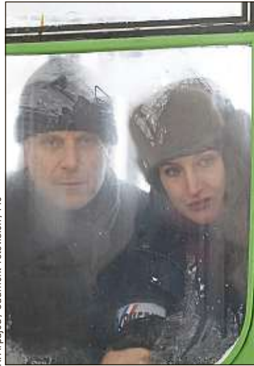
Charles Berling (à gauche) et Julia Piaton jouent dans « Glacé ».

M6 ne semble pas vouloir se différencier des autres productions. « Glacé » est ainsi l'adaptation du roman de Bernard Minier, un best-seller à près de 500 000 lecteurs et donc des millions potentiels de téléspectateurs. A Saint-Martin, une petite ville des Pyrénées, un cheval dépecé et décapité est