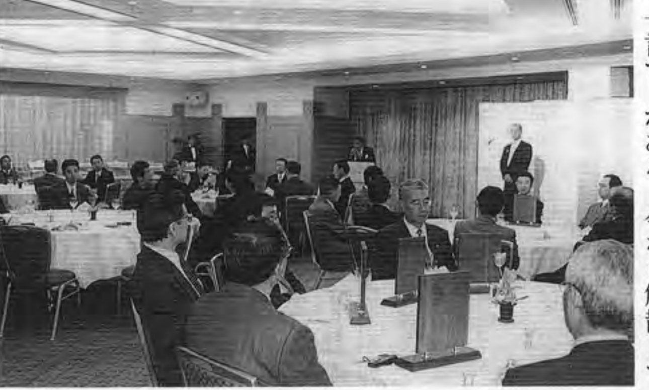
解散を決めたJOU通常総会(上)と、総会後の懇親会の様子