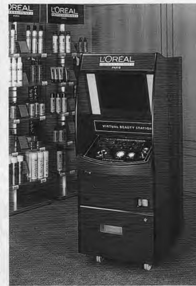
「バーチャルビューティステーション」

ナムコとロレアル共同開発 ナムコはフランス大手された。撮り込んだ顔写真に、何種類ものヘアスタイルを組み合わせる。ロレアルの製品で、今度の製品では、合成シールをプリントする。