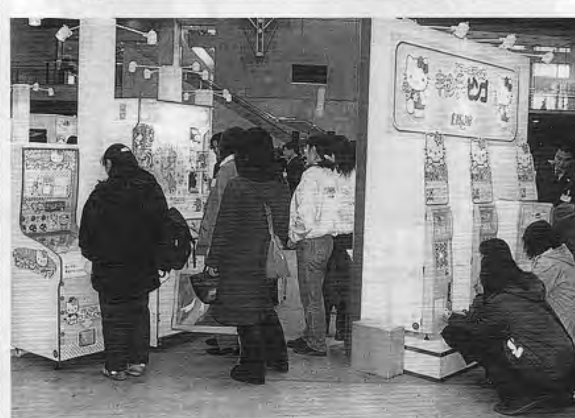
上の写真は景品とともに「キティ」キャラ使用のプライズ機や自販機も出品したエイコー、下はプライズ機新作を披露したNMKの小間