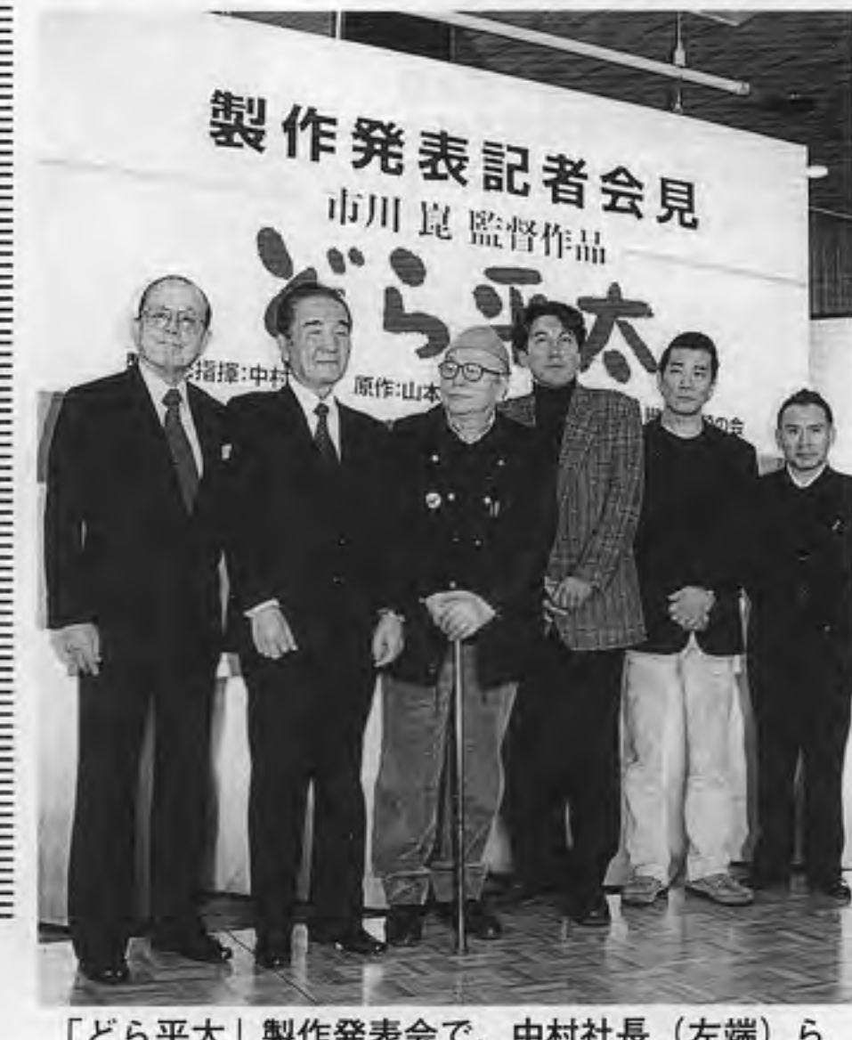
「どら平太」製作発表会で、中村社長(左端)ら

来年公開「どら平太」で 来年公開「どら平太」で、市川崑監督の映画制作に意欲を示している。また新人監督にもチャンスを与えたいと語る。