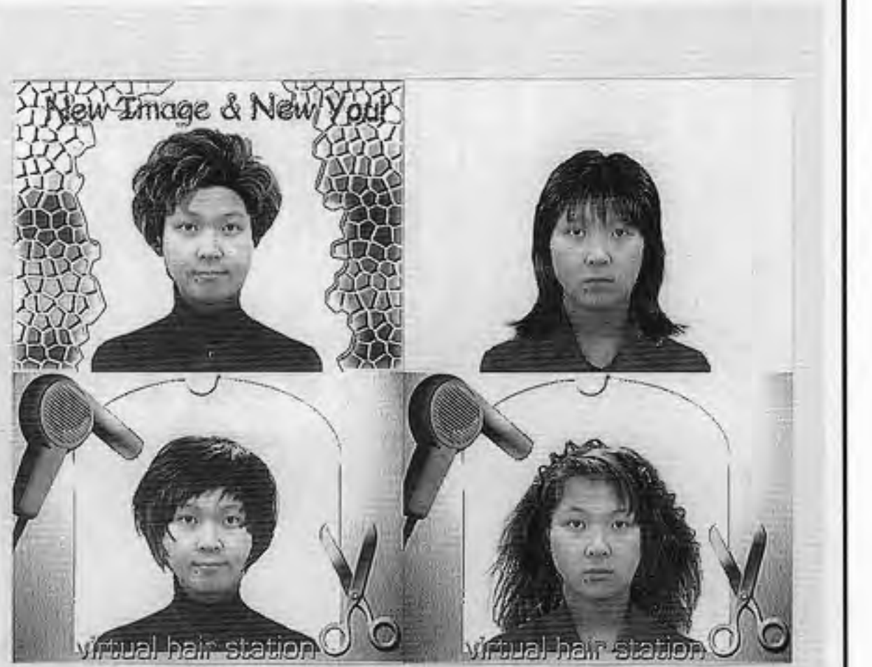
「バーチャルビューティステーション」のプリント例から