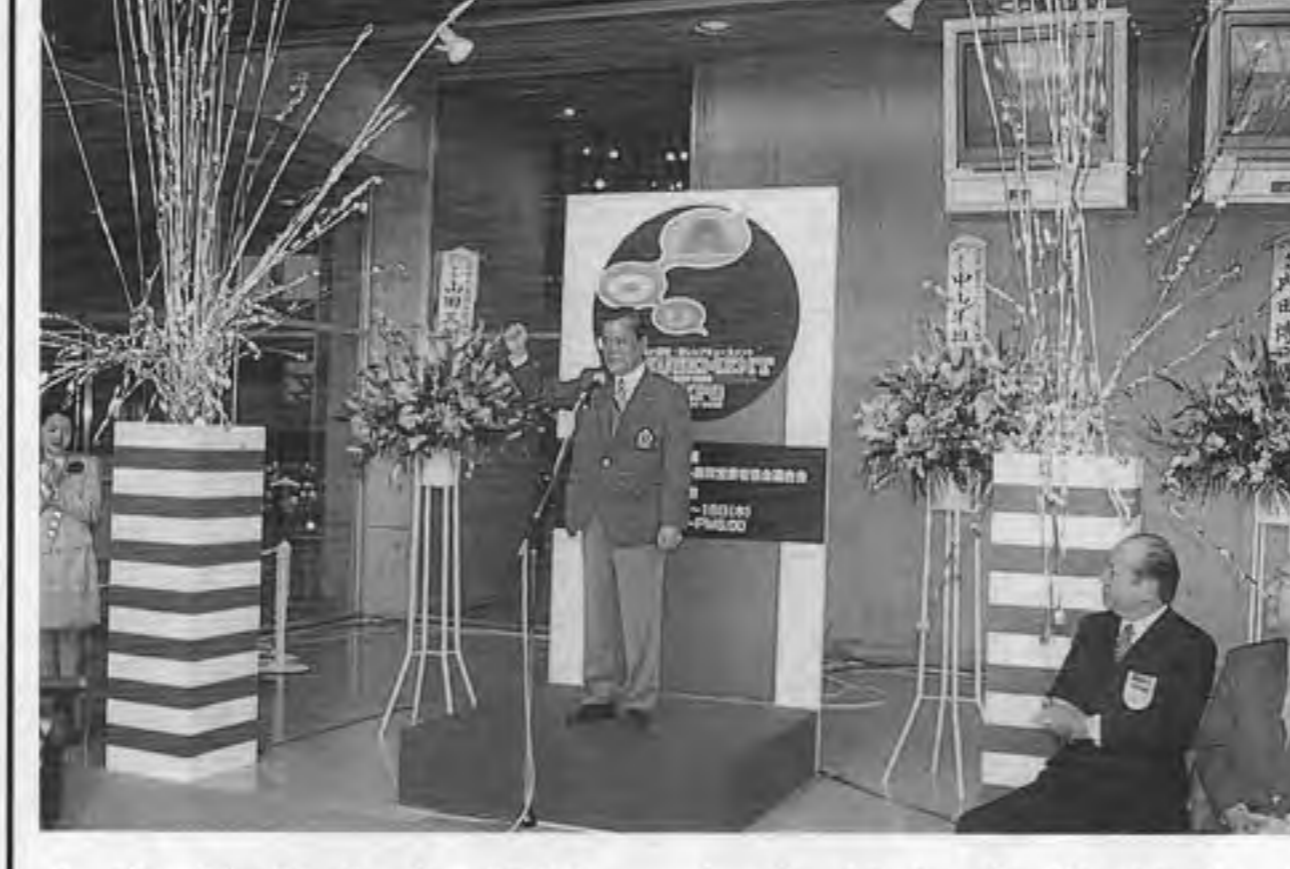
解散を決めたJOU通常総会(上)と、総会後の懇親会の様子