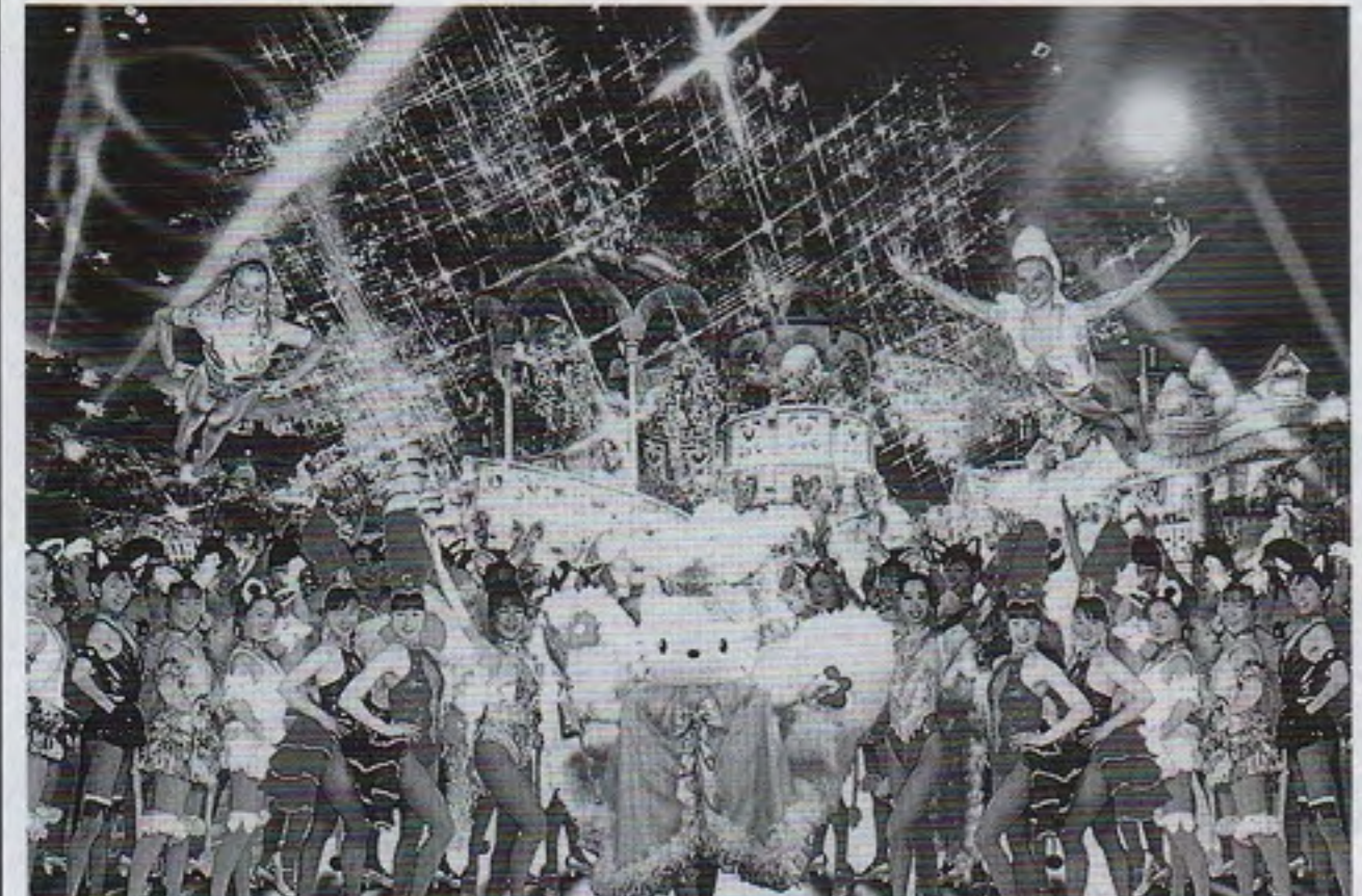
ピューロランドで6月から始まるアクロバットショーのイメージ写真

サンリオピューロランド 徴がある。ド(東京都多摩市、株ササンリオオリオ・コミュニケーショールンリオの人気キャラ「ハード」にキティ)誕生二十五周年記念イベントを二月から開催しており、その中「キティ」の初恋の「ダニエル」が、三月十日で三日初登場する。「ダニエル」は「キティ」誕生二十五周年を記念して作られた新キャラで、顔は「キティ」と同じだが、頭の部分が違い、真つすく立った前髪に特