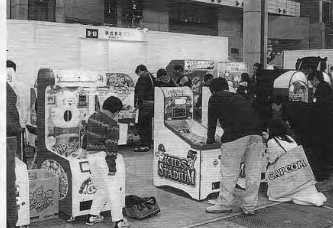
上の写真は「つかんでポンポコ」など新作3機種を披露したこまや、下は大型景品対応「ファンシーリフター」を出品したカトウ製作所

「タワオークシヨンのよい相手を教える」「デパートアップした景品」を参考出品した。