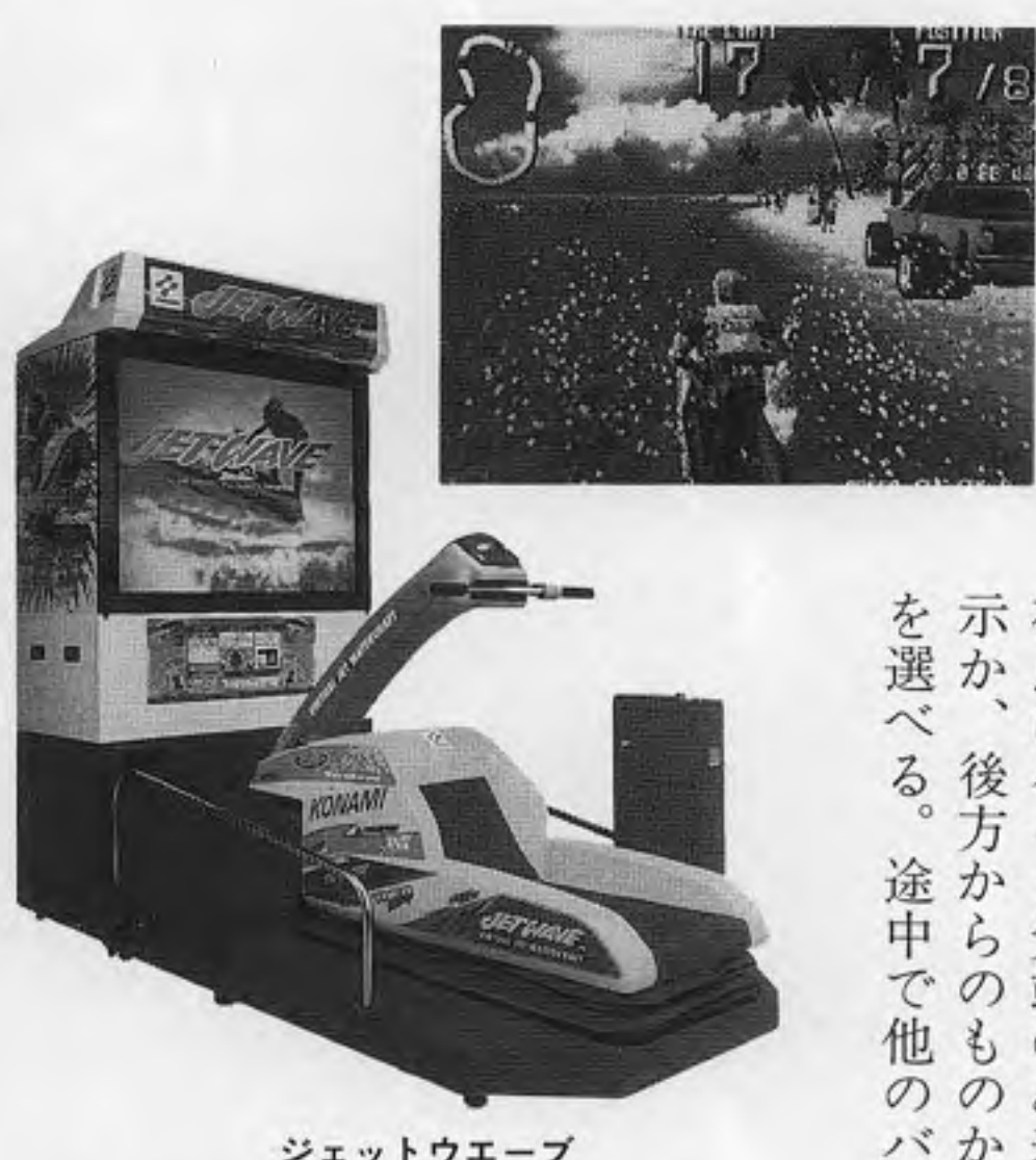
ジェットウエーブ

コナミ(本社東京、上月景正社長)からTV「ジェットウエーブ」が六月下旬発売となる。またTV野球ゲーム「実況パワフルプロ野球96」が六月初め発売となった。「ジェットウエーブ」は、水上バイクをデフォルメした乗物部分に立って乗り、CG画像による海上コースを走行していくゲーム。プレイヤーは