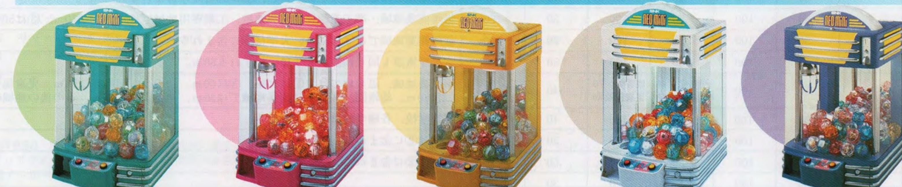
ネオミニグリーン