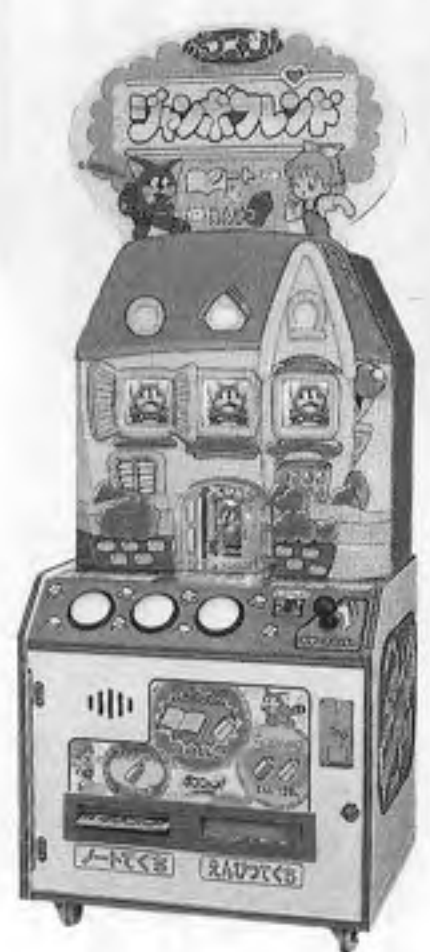
ジャンボフレンド

カプコン(本社大阪、辻本憲三社長)から、プライズゲーム機「ジャンボフレンド」が六月五日発売となった。これは「ボコニャン」キャラクターを採用したもので、景品にノートと鉛筆を使用しており、景品出し口が二つある。メカスロット式で、レ