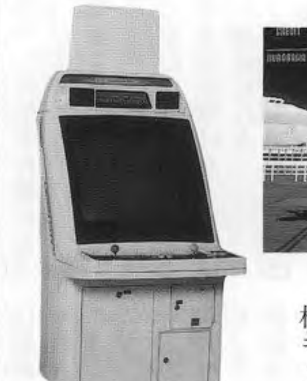
ラストブロックス(上はラストブロックス、下はバーサシティ)

セガ・エンタープライゼス(本社東京、中山八方向レバーと三つ(ガ)集雄社長)から、「モデル2」によるCG武器格闘ゲーム「ラストブロックス」が六月十四日発売となった。これは抗争を繰り返している八つの若者グループのリーダーが、覇権を得るための試合を展開するという設定で、仮想都市「東京」が舞台だが、渋谷駅前など実際の景観