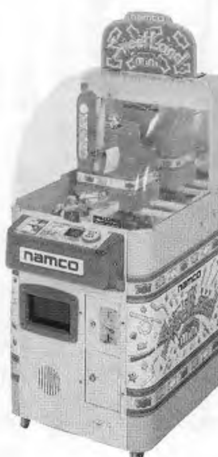
スイートランドミニ

「システムスローパー」は、システムスローパー22」基板を使用したCGゲームで、ある村の一部が空高く舞い上がり浮遊島「ソリター」となってしまう。これを取り戻すため村の勇者が人力飛行機で「ソリター」に向かうというストーリーになっている。プレイヤーは自転車のように座席に座ってペダルを踏むと、その回転に