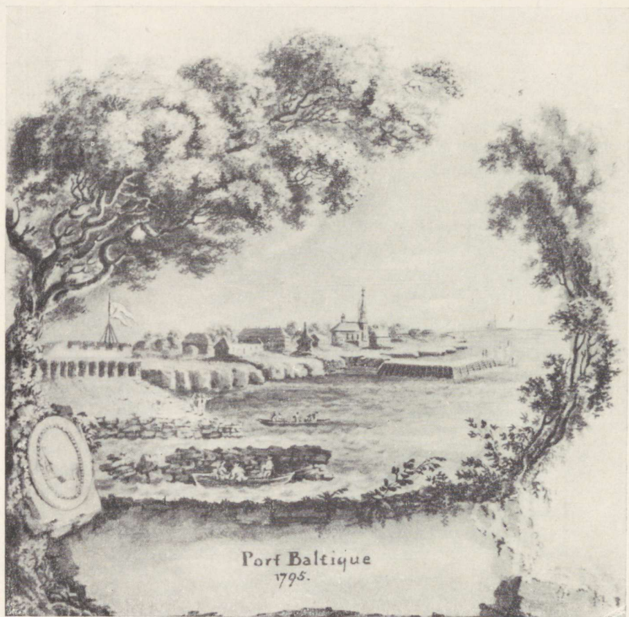
Port Baltique 1795.