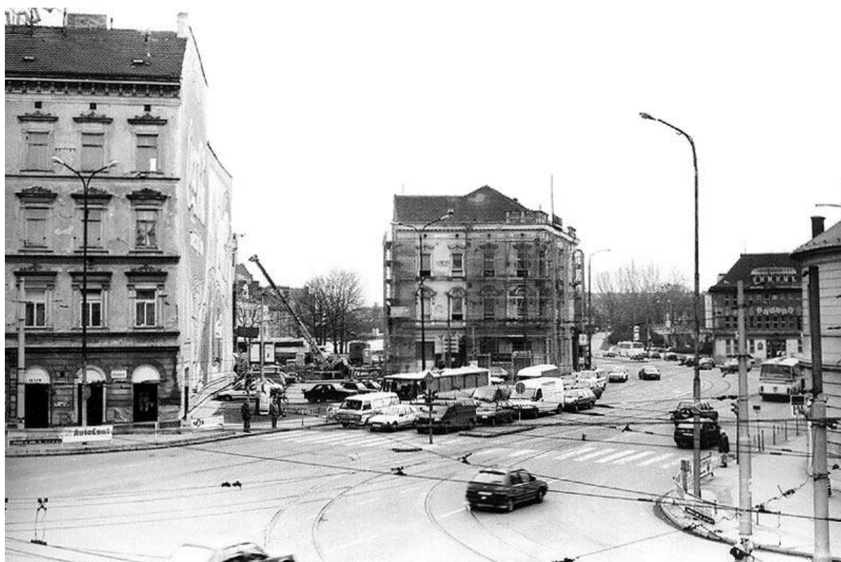
Příloha č. 13 – Hotel Metropol, dříve Evropa, v roce 1998 284