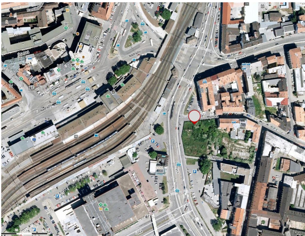
Příloha č. 15 – Místo, kde stával hotel Metropol, na leteckém snímku 286