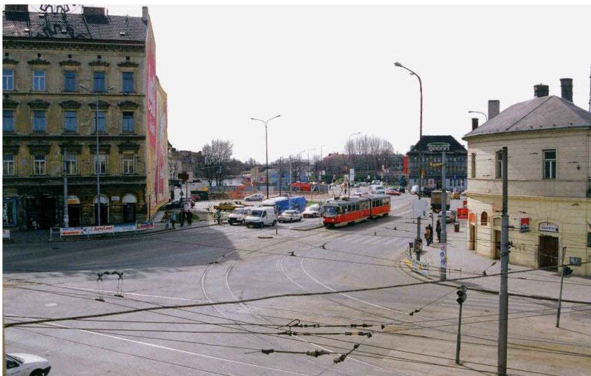
Příloha č. 14 – Místo, kde stával hotel Metropol (rok 2000) 285