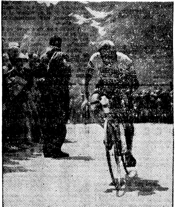
El español Campillo, compañero fiel de Bahamontes, que ayer se destapó escalando varios 'coles' en primera posición.

Estimula los reflejos aportando gran vivacidad mental y energía física.