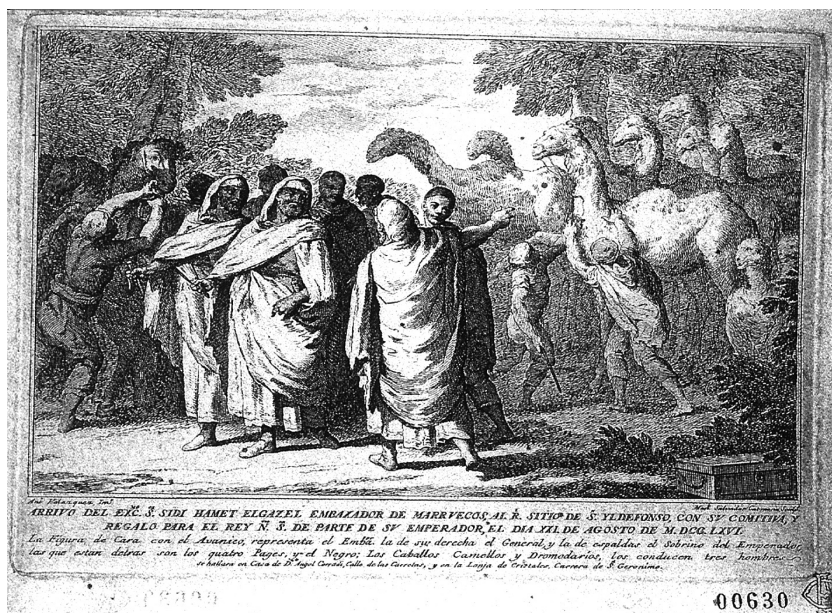
Fig. 2. Antonio González Velázquez, Llegada del embajador marroquí a San Ildefonso en 1766.

sólo sobrevivían ocho: tres domados y cinco que pastaban libres en el campo 71 . Hacia 1760 los camellos que se destinaban a faenas en el real sitio eran ya tan pocos que se recogían en el patio de la casa de los guardabosques, conocida por ese motivo como la Casa de los Camellos 72 .