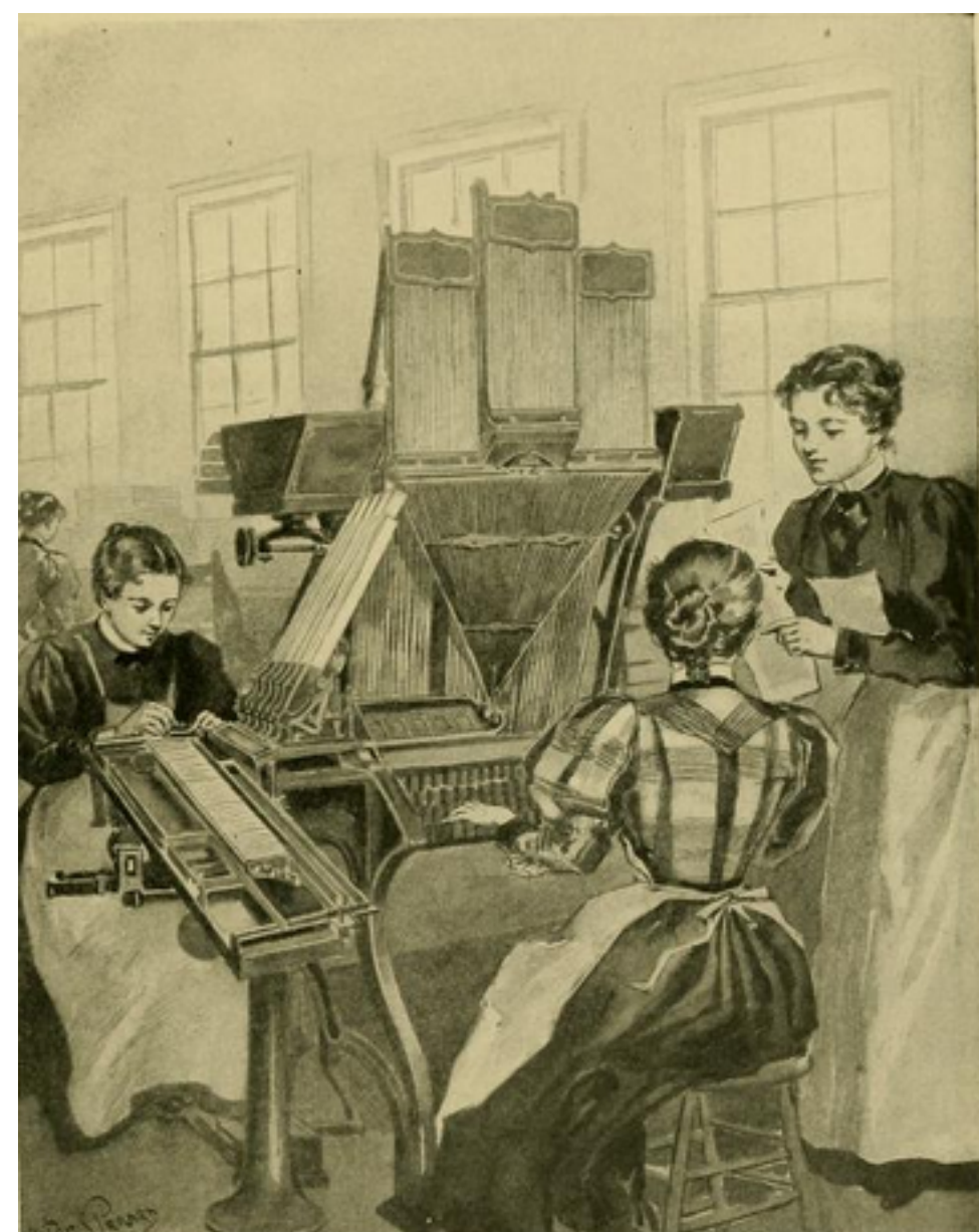
Figure 1: Lorem ipsum dolor sit amet, consectetur adipiscing elit, sed do.

Lorem ipsum dolor. Lorem ipsum dolor sit amet, consectetur adipiscing elit, sed do eiusmod tempor incididunt ut labore et dolore magnam aliquam quaerat voluptatem. Ut enim aequae doleamus animo, cum corpore dolemus, fieri tamen permagna accessio potest, si aliquod aeternum et infinitum impendere malum nobis opinemur. Quod idem licet transferre in voluptatem, ut postea variari voluptas distinguere possit, augeri amplificarique non possit. At etiam Athenis, ut e patre audiebam facete et urbane Stoicos irridente, statua est in quo a nobis philosophia defensa et collaudata est, cum id, quod maxime placeat, facere possimus, omnis voluptas assumenda est, omnis dolor repellendus. Temporibus autem quibusdam et.