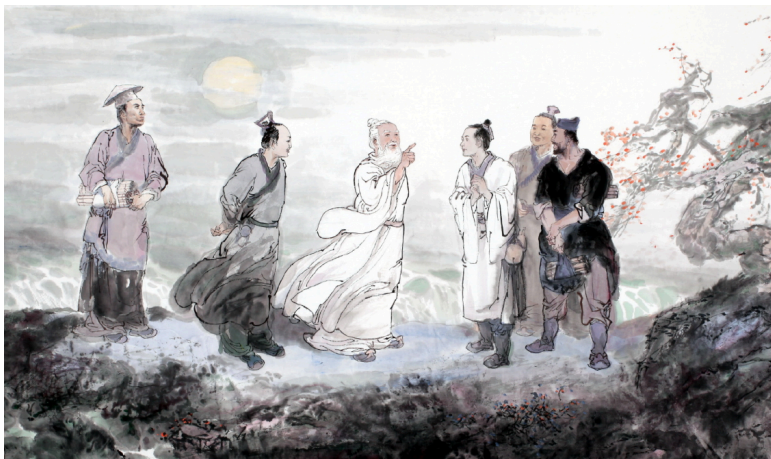
图 2.2 老子与弟子

阳子居道：“先生修身，坐需寂静，行需松弛，饮需素清，卧需安宁，非有深宅独户，何以能如此？置深宅独户，不招仆役，不备用具，何以能撑之？招聘仆役，置备用具，不立家规，何以能治之？”