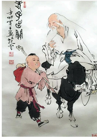
图 2.4 老子出关

老子出关一直被人们津津乐道地传说着，演绎着。鲁迅先生也对此发生过兴趣，还专门创作了故事新编《老子出关》，还与别人打了一点笔墨仗。另外，老子出关中的“紫气东来”也成了中国文化中的一个基因，帝王之家将“紫气”当作吉祥、祥瑞，你看生个孩子如果紫气满室，古人认为这孩子必定大有出息。老百姓之家也把“紫气”当作吉祥的象征，于是把“紫气东来”这些字写在大门上等等。先民还认为，哪个地方有宝物，哪个地方就会在上空出现紫气。