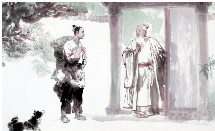
图 2.3 老子游历

南荣拜见老聃，道：“弟子南荣，资质愚钝难化，特行七日七夜，来此求教圣人。”老聃道：“汝求何道？”“养生之道。”老聃曰：“养生之道，在神静心清。静神心清者，洗内心之污垢也。心中之垢，一为物欲，一为知求。去欲去求，则心中坦然；心中坦然，则动静自然。动静自然，则心中无所牵挂，于是乎当卧则卧，当起则起，当行则行，当止则止，外物不能扰其心。故学道之路，内外两除也；得道之人，内外两忘也。内者，心也；外者，物也。内外两除者，内去欲求，外除物诱也；内外两忘者，内忘欲求，外忘物诱也。由除至忘，则内外一体，皆归于自然，于是达于大道矣！如今，汝心中念念不忘学道，亦是欲求也。除去求道之欲，则心中自静；心中清静，则大道可修矣？”南荣闻言，苦心求道之意顿消。如释重负，身心已变得清凉爽快、舒展旷达、平静淡泊。于是拜谢老聃道：“先生一席话，胜我十年修。如今荣不请教大道，但愿受养生之经。”