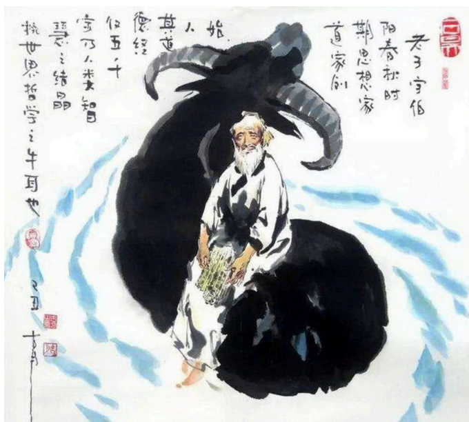
图 4.1 老子

只有一个人，真正找到了自己的生命的意义，抱定一个价值观毫不动摇，敢于面对任何挑战，就是老子所说的“不失其所者久，死而不亡者寿”，也只有达到了这个境界，才能看清事情本质，把自己的自然完美的融合，最终从道中来，到道中去。