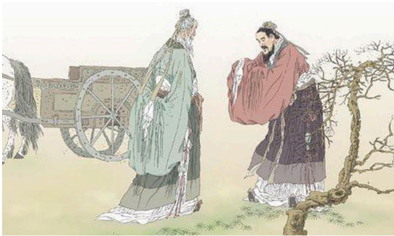
图 2.1 孔子问礼

公元前 538 年的一天，孔子对弟子南宫敬叔说：“周之守藏室史老聃，博古通今，知礼乐之源，明道德之要。今吾欲去周求教，汝愿同去否？”南宫敬叔欣然同意，随即报请鲁君。鲁君准行。遣一车二马一童一御，由南宫敬叔陪孔子前往。老子见孔丘千里迢迢而来，非常高兴，教授之后，又引孔丘访大夫苾弘。苾弘善乐，授孔丘乐律、乐理；引孔丘观祭神之典，考宣教之地，察庙会礼仪，使孔丘感叹不已，获益不浅。逗留数日。孔丘向老子辞行。老聃送至馆舍之外，赠言道：“吾闻之，富贵者送人以财，仁义者送人以言。吾不富不贵，无财以送汝；愿以数言相送。当今之世，聪明而深察者，其所以遇难而几至於死，在於好讥人之非也；善辩而通达者，其所以招祸而屡至於身，在於好扬人之恶也。为人之子，勿以己为高；为人之臣，勿以己为上，望汝切记。”孔丘顿首道：“弟子一定谨记在心！”