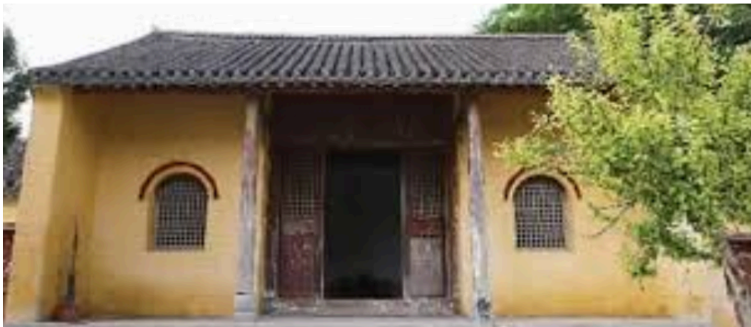
图 2.5 太清宫

据史志记载，东汉延熹八年（公元 165 年），汉桓帝刘志派中常侍管霸前来创建，始名老子庙。唐祖武德三年（公元 620 年），李渊为了便于对天下的统治，抬高家族地位，就听从吉善行的建议，认老子为祖宗，派人在汉老子庙的基础上予以扩建，规模如京城王宫，做为皇室家庙。乾封元年（公元 666 年），唐高宗李治追封老子为“太上玄元帝”，并增建“紫极宫”、“太清楼”，改庙名为“玄元庙”。到武则天光宅元年（公元 684 年），又册封老子母为“先天太后”，在汉李母庙的基础上，扩建成洞霄宫，位置在太清宫北一里。至玄宗李隆基时，太清宫又有增建，规模达到鼎盛，占地八顷七十二亩，周围四十里，宫内建筑排列有序，琼楼玉宇，金碧辉煌。太清宫称前宫，洞霄宫称后宫。前宫祀老子，后宫祀李母。两宫中隔一河，河上有桥。河名“金水”，桥称“会仙”。