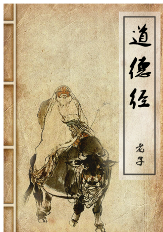
图 3.1 道德经

《道德经》又称《老子》，是中国古代先秦诸子分家前的一部著作，为其时诸子所共仰，传说是春秋时期的老子李耳所撰写，是道家哲学思想的重要来源。道德经分上下两篇，原文上篇《德经》、下篇《道经》，不分章，后改为《道经》在前，《德经》在后，并分为 81 章，全文共约五千字，是中国历史上首部完整的哲学著作。