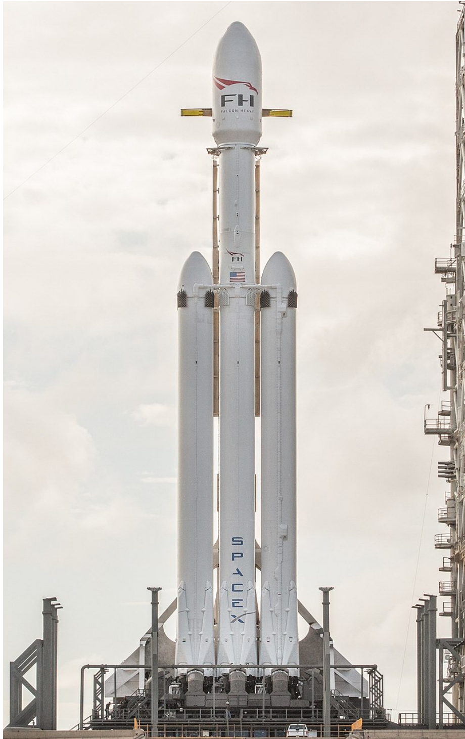
Figure 2: This is an image.