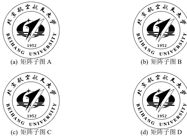
图 5 矩形的 subfig 排列

若要将四个或多个图形以矩阵形式排列，可以参见图5，四个子图分别为图5(a)、图5(b)、图5(c)和图5(d)。