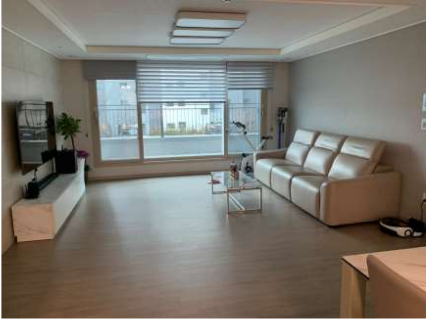
Java, kotlin 클래스로 구성