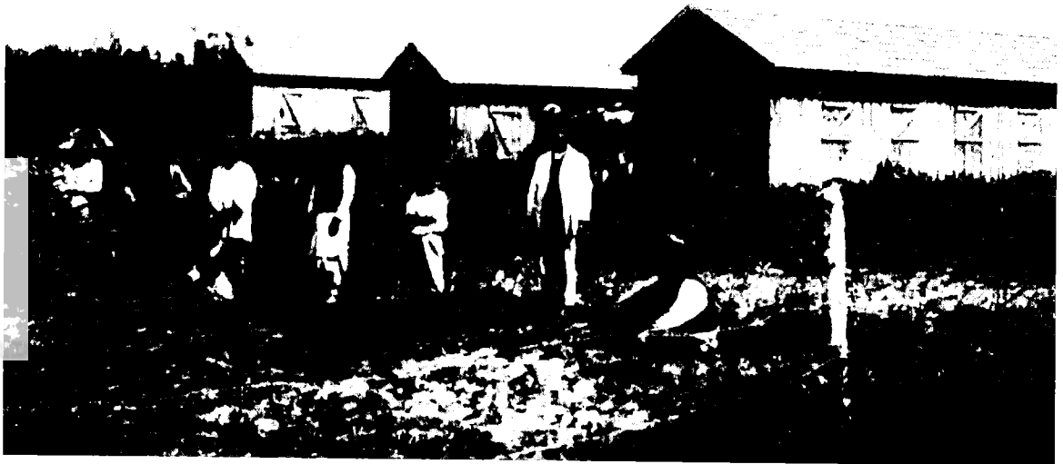
יהודי תימן בראשון-לציון ליד צריפיהם

החלטה זו של ועד המושבה הובאה כנראה לידיעת 'המשרד הארץ-ישראלי' ומפלגות הפועלים. כאשר הגיעה קבוצת העולים מחידאן ליפו קיבל את פניהם יוסף שפרינצק, ממנהיגי 'הפועל הצעיר', ובתיאום עם 'המשרד הארץ-ישראלי', אך ללא תיאום עם ועד המושבה ראשון-לציון, הפנה ארבע-עשרה משפחות מקבוצה זו לראשון-לציון. שפרינצק ועוד נציג מ'המשרד הארץ-ישראלי' ליוו את