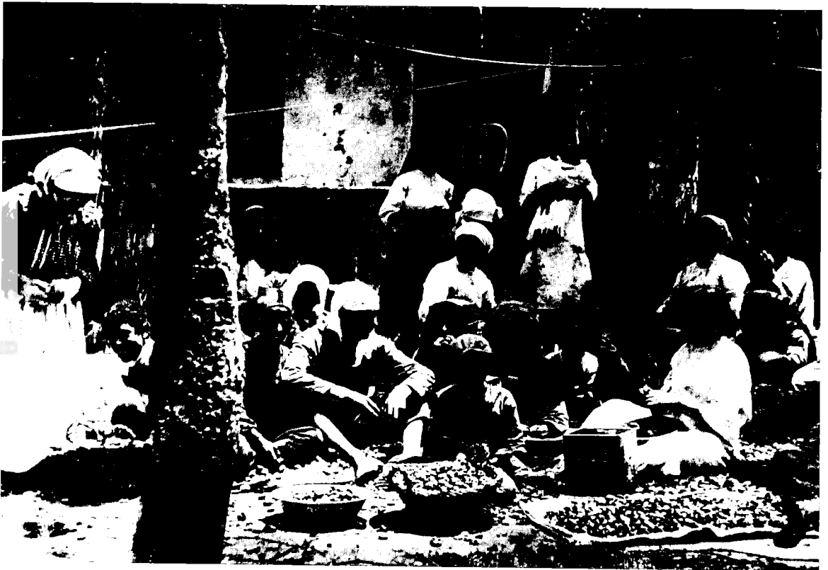
קילוף שקדים בראשון-לציון (1912)

בחקלאות, בכרמי השקדים והגפנים של איכרי המושבה, וכשומרים - מרביתם היו פועלים זמניים שעבודתם תלויה בצורכי העבודה על-פי עונות השנה. כמה מהם עבדו ביקב, בתור פועלים קבועים או פועלים זמניים ועונתיים, אחדים עבדו כסנדלרים, רצענים, נפחים ובנאים, והיו ביניהם גם קצבים, ושני שוחטים. 19 נשים תימניות עבדו בעונה החקלאית הנוערת בבציר ענבים ובקטיף שקדים ומדי פעם בעבודות השדה האחרות וכן בעבודות משק הבית בבתי האיכרים, ולפעמים הן היו אלו שכלכלו את בני ביתן. 20