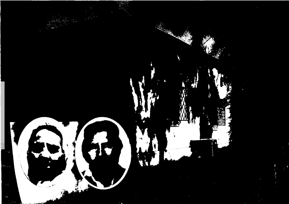
משפחת סעדיה בשארי על רקע ביתם

עם תום המלחמה שבו אט אט החיים למסלולם והתימנים קיוו לממש את חלום ההתישבות שלהם: 'התחלנו שוב להתעורר ולעורר את המוסדות המיישבים ולחפש על שרידי המשרד הא"י'. במיוחד חיפשו את שפרינצק, שעמו היו בקשרים קרובים וידידותיים, וביקשו עזרה בבניין הבתים בנחלת-יהודה. ואילו לגבי האדמה, ציין טביב, 'היינו בטוחים שכבר נגמר עינינה, וכל אחד כבר יודע מקומו וחלקתו ורק מחכים לבנין ולא ידענו מה מכינים לנו'. 50