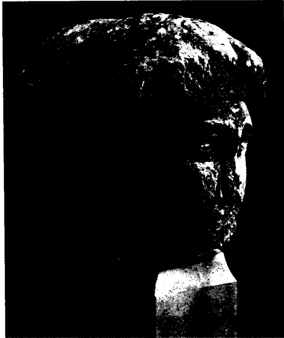
איור 5: הרמה כפולה, מטיפוס יאנוואדרי, של דיוניסוס

ולזר הקיסוס עם אשכולות הענבים המעידים שהדמות שייכת לחוגו של דיוניסוס. בפן השני חסרים האף, הפה והסנטר, השיער גלי ואסוף לאחור וטניה מעטרת את המצח. הפסל זוהה על ידי פיצג'רלד כאל הרומי יאנוס, 29 אך גרשט מזהה בפן האחד את דיוניסוס ובאחר, בעל האופי הנשי, את אריאדנה או את ניסה אומנתו. 30