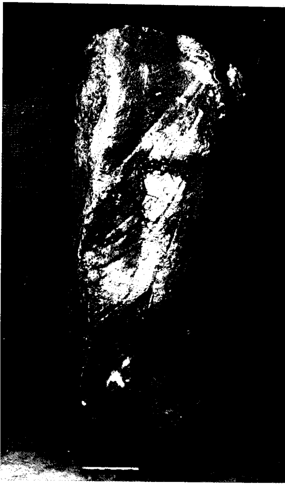
איור 4: טורסו של דיוניסוס לבוש עור חיה

אך ייתכן כי עוצב בדומה לראש הפסל שנתגלה בסטיו ולראשים של פסלים אחרים שנמצאו מחוץ לתחומי ארץ-ישראל. 23 כל הסימנים מעידים שזהו פסל של האל דיוניסוס. 24 טורסו של דיוניסוס בעל מידות דומות 25 נמצא באפסוס (היום במוזאון הבריטי), גם הוא לבוש בגד עור המקיף את הגוף כאלכסון ומסתיים בראש תיש או גדי. הבגד קשור על כתף שמאל בטלף של גדי וקווצות שיער ראשו של דיוניסוס השתמרו על הכתפיים. 26 הפסל מתוארך לסוף התקופה האנטונונית. דמיון כלשהו ניתן למצוא בין הפסל מבית-שאן ובין טורסו של דיוניסוס משומרון. 27 על חזהו של הפסל משומרון ניכרים שרידי עור חיה ואשכול ענבים, אך נראה כי פסל זה פחות סטטי; הגוף נוטה לשמאל והיד הימנית היתה כנראה מורמת והראש פנה שמאלה. במהלך החפירות של המשלחת האמריקנית התגלתה, בשימוש משני, הרמת כתף כפולה מטיפוס יאנואידי (איור 5). 28 פן אחד הושחת עד כדי כך שלא ניתן לתארו, פרט לטניה על המצח