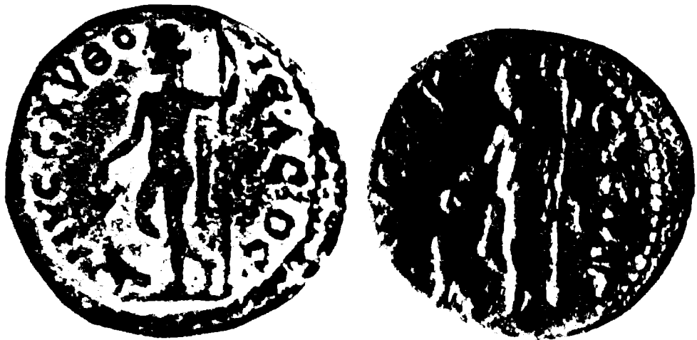
איור 3 (משמאל): מטבע מימי גיטא עם דמות דיוניסוס (207 לספירה)

1.80 (איור 1). 11 גובה החלק שנשתמר הוא 1.24 מ' ויש לשער שגובהו המקורי של הפסל היה מעל 1.80 מ'. הפסל ניזוק למדי ועל הסנטר יש סימנים של ניתוך מכוון, שכתוצאה ממנו הושחתו האף, הפה והעיניים. לדעת החופרים השחתה זו היא פרי מלאכתם של נוצרים שביקשו לבזות את פסל האל. 12 הפנים מלאות וצעירות, העיניים קטנות ושקדיות ללא גילוף האישונים, תוך הדגשת המבט החולמני הבלתי ממוקד. למרות הפגיעות ניכר יופיים של תווי הפנים. חלקו האחורי של הפסל גולף היטב, אך בחלקים מסוימים נותר ללא ליטוש, ועל הצוואר יש בליטה לתמיכה — פרטים המעידים שהפסל ניצב בסמוך לקיר או נשען אליו. דיוניסוס מתואר מן החזית כצעיר עירום, עומד בתנוחה רפויה. הגוף לא השתמר בשלמותו: הרגליים שבורות מעל לברך והידיים השתמרו רק מעט מעבר לכתף, כך שלא ניתן לקבוע בוודאות את תנוחתן. ליד רגל שמאל ניתן להבחין בשבר של עמוד או גזע שעבודו לא הושלם. הגוף מעוצב בצורה מעודנת, רכה ונשית בדומה לפסל דיוניסוס מטיפוס Woburn Abbey (איור 10) ובול. 13 למרות הקונטרפוסטו ההפוך (תמונת ראי) של הפסל מבית שאן, ניתן לייחס גם אותו לטיפוס זה.