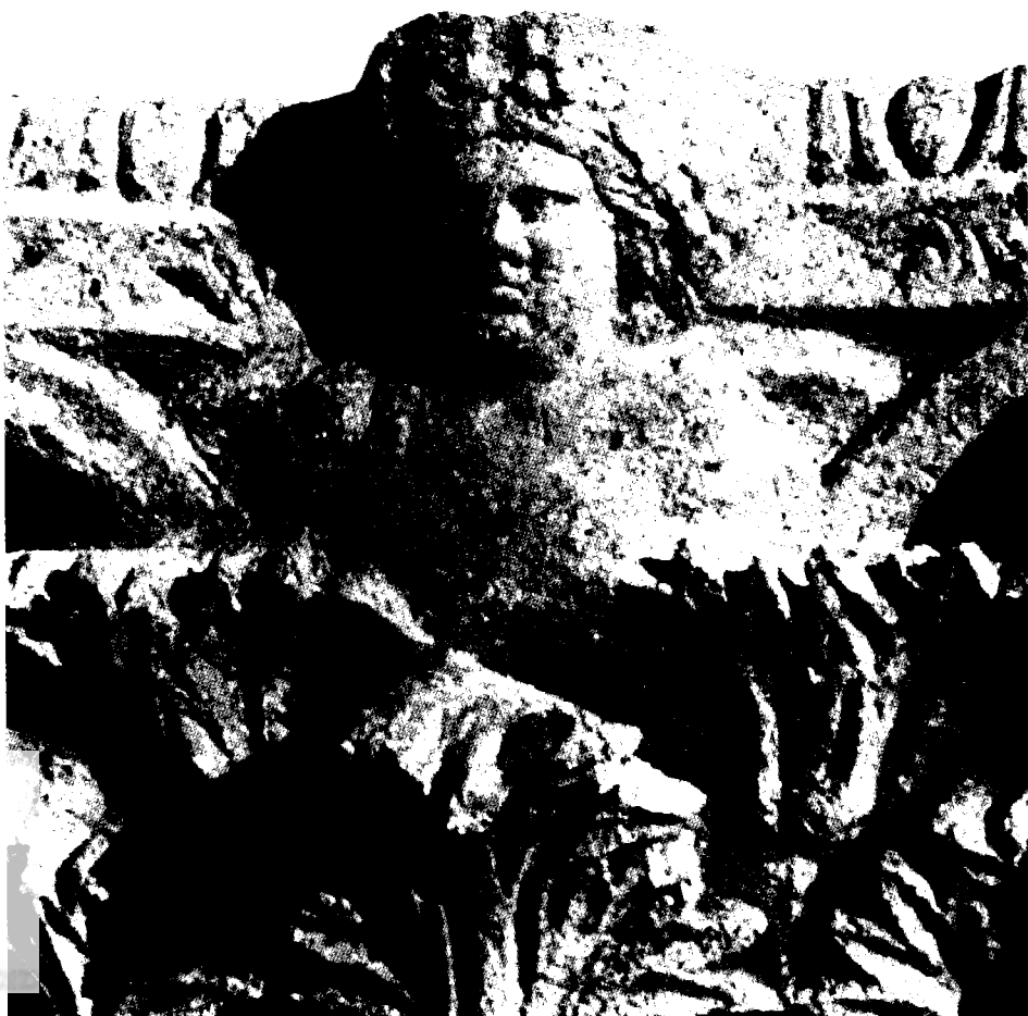
איור 8 : דיוקן דיוניסוס מגולף באַבְּקוּס של כותרת קורינתית מבית שאן

מן התקופה הרומית בבית-שאן, המתייחסת להערצתו של דיוניסוס. 39 מן הראוי להזכיר כאן גם פְּרוֹטוֹמָה של דיוניסוס המגולפת באַבְּקוּס של כותרת קורינתית שנמצאה בשימוש משני (איור 8). 40 בפרוטומה זאת מתואר דיוניסוס הצעיר חסר זקן, פניו מלאים ומגושמים, הסנטר מעוגל וכבד, פה קטן עם שפתיים מלאות, עינים צרות ומוארכות, אף רחב ומצח נמוך. הראש מפוסל בתבליט גבוה, מוקף שיער שופע ומסולסל, חצוי במרכזו ועטור באשכולות ענבים. הצוואר קצר והכתפיים מעוגלות, על כתף ימין ניתן להבחין במעין רצועה, אולי קווצת שיער או שולי בגד. למרות השימוש בשיש, המשטח העליון של הכתפיים והחזה הוא בעיבוד גולמי, הפרופורציות מגושמות והעבודה בכללה גסה וחסרת עידון. דמיון מסוים לפרוטומה זו, כפיזיונומיה של הפנים, במיוחד בטיפול בשיער והפרטים המלווים אותו, ניתן למצוא בפסל דיוניסוס מן המחצית הראשונה של המאה השנייה (תקופת הדריאנוס) שנתגלה בתיאטרון של לֶפְסִיס מַגְנָה. 41