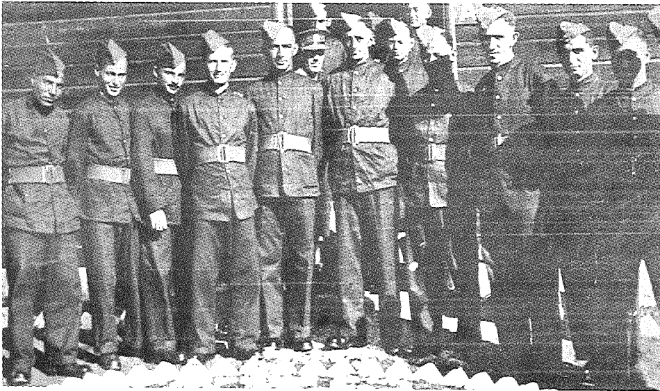
מראשוני המתנדבים לצבא הבריטי, צריפין, ספטמבר 1939

החיילים חששו מפני הצפוי להם עם השיבה ארצה לאחר שנים רבות של ניתוק חברתי ושל ניתוק ממקורות תעסוקה ופרנסה: 'הידעו מיליוני החיילים לעבור ממלאכת ההשמדה לחיי יצירה קשים? החיילים בעלי משפחות כרווקים הוצאו ממערכת היצירה בארצם. מקומותיהם תפושם על ידי אחרים. הבעיה העיקרית: כיצד למנוע מן החייל המשוחרר את חרפת הרעב? 11