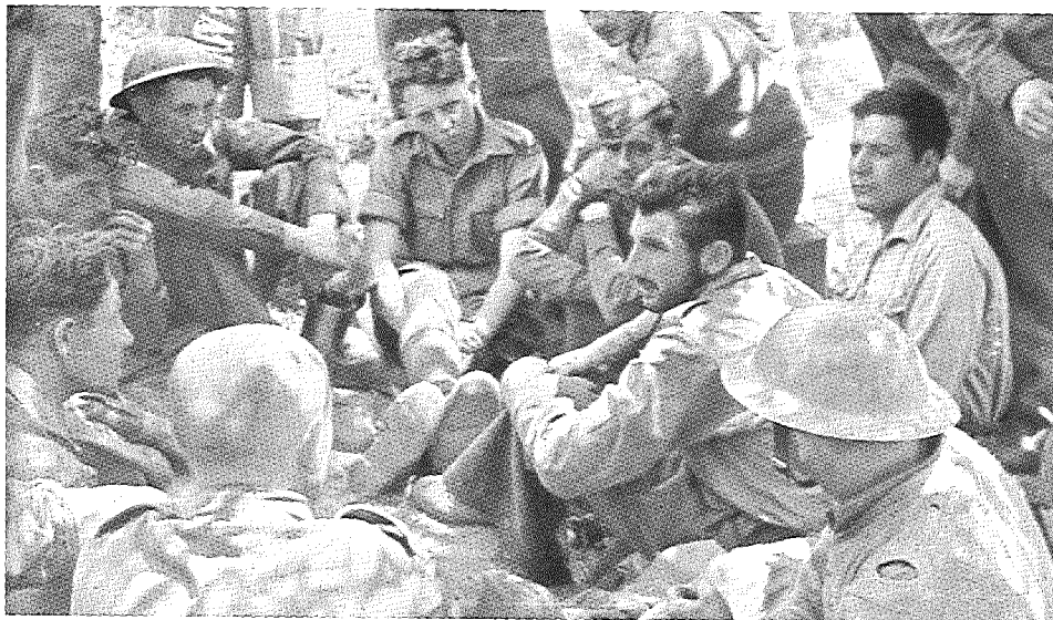
מפגש עם חייל שנמלט מן השבי ביוון

ביולי 1943, לאחר מפלת הצבא הגרמני באלעלמיין (23 באוקטובר 1942) ועם סיום המערכה בצפון אפריקה, הועלה רעיון ההתיישבות בעלון פלוגת ספקי המים של חיל התובלה המלכותי. הרעיון הוצג כפתרון כלכלי לחייל החוזר לארצו. 26