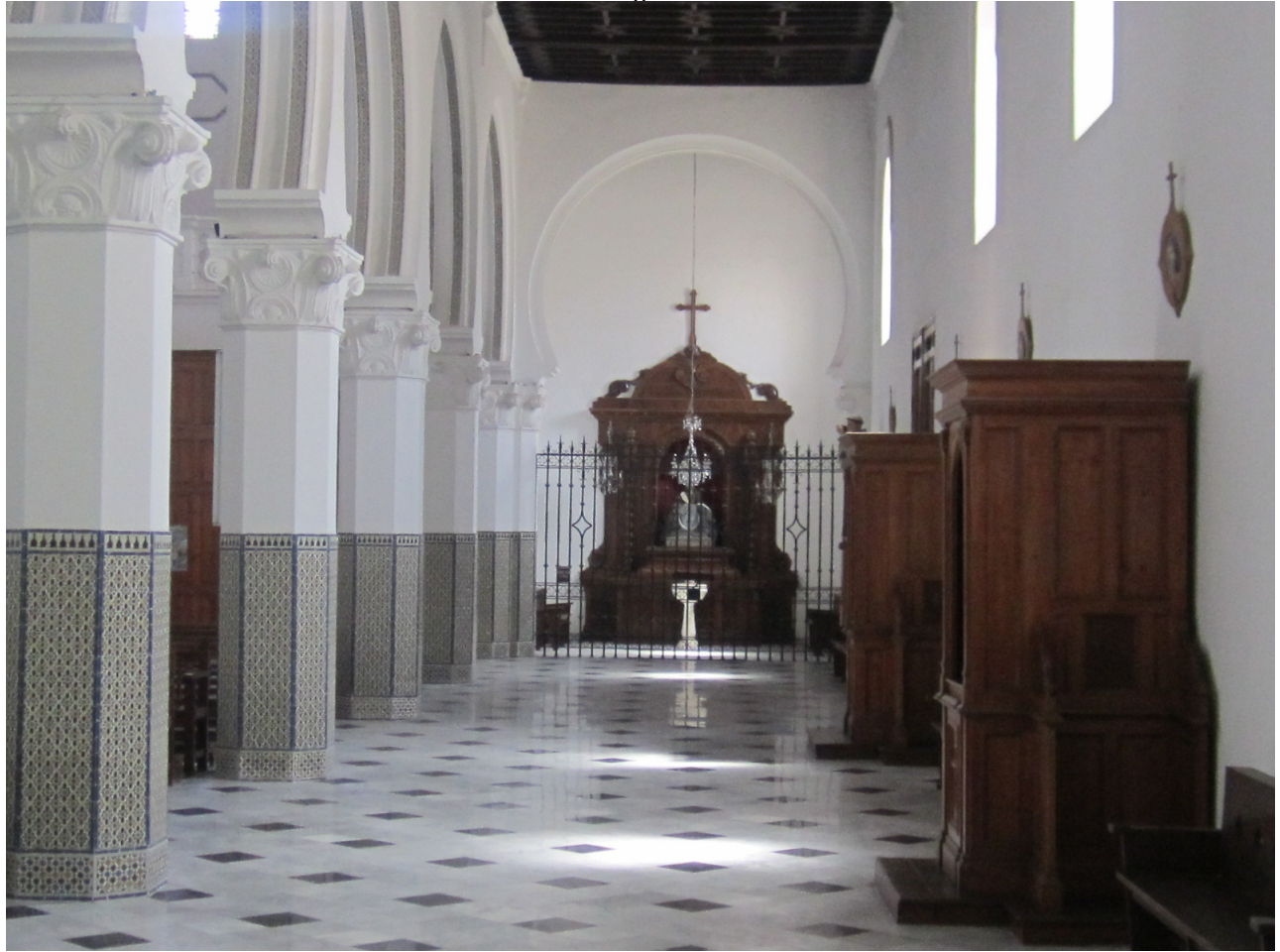
Interior de la Iglesia restaurado hace 10 años. Se mantiene en buenas condiciones