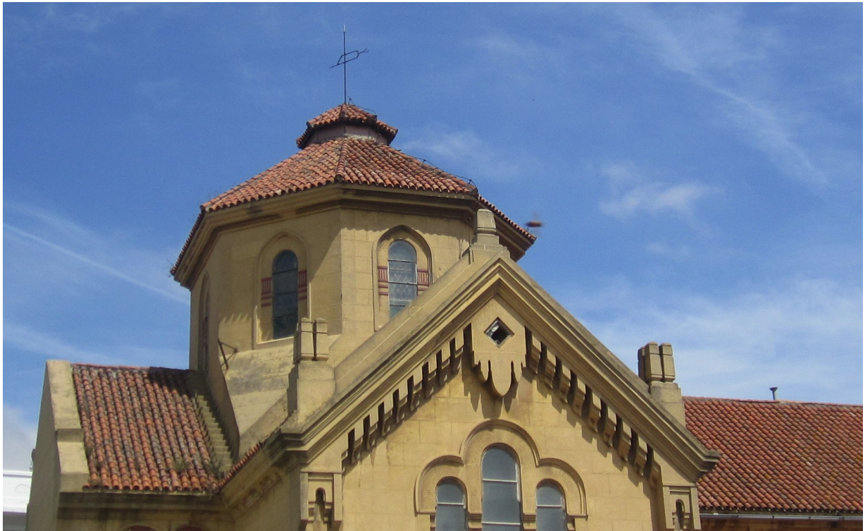
La torre sobre el altar principal (Linterna). La teja lleva casi 90 años, desde la fundación de la Iglesia de 1925.