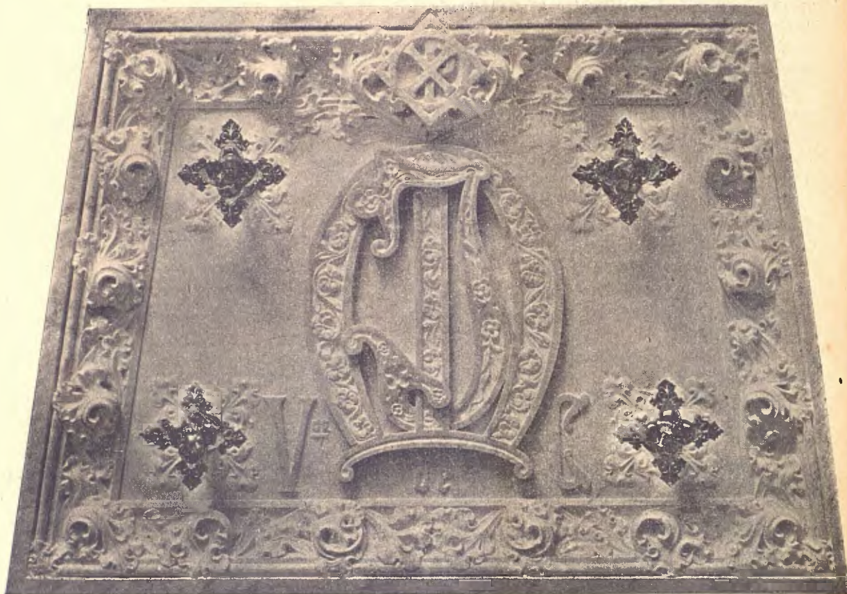
Tapa de sepulcre.—PIQUET.