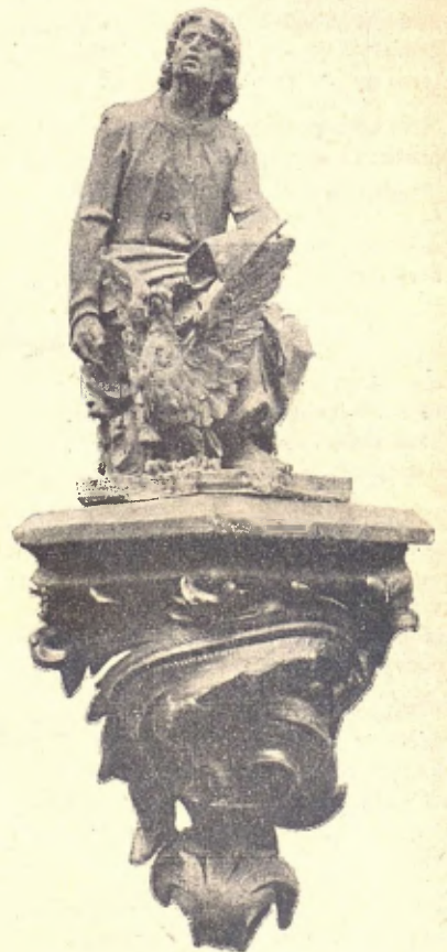
Sant Joan Evangelista.—PIQUET.

Noshavist I duptava de 'ls ministres y era