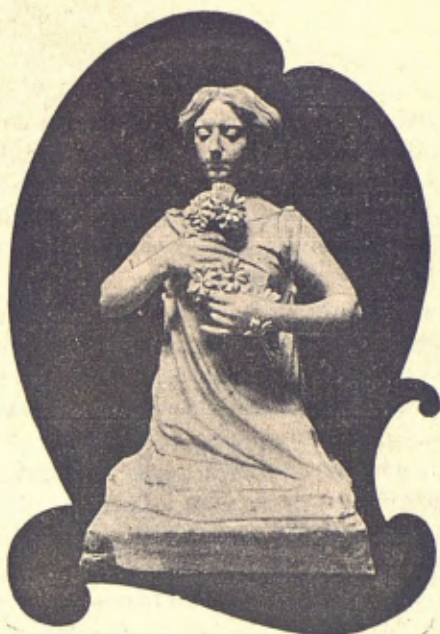
Figura decorativa —PIQUET.

Ajustá portas perque 'l vent á esquitllentas no 'ls obrís y 'ls llops no 'l torbessin durant la