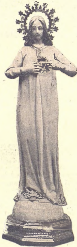
El Sagrat cor de Maria. — PIQUET.

La cara amoratada, los ulls envidriats, un moquim de sang escorrentse, cabells esbullats coronan la testa, el cos ensorrat al tou del marfegot, els brassos mostren las feridas closas per el fret de la mort... A la llum esmortuïda, oscilant, que téticament la cambra illuminava prou sobrava perque'n Nuri á l'espona del llit frech á frech d'ella la contemplés aquella boca badada que ni Deu la feya clourer apres de tantas provaturas que feren per no ovirarne l'engranall de perlas, dents ennegreidas per lo tuf empudegat que 'l cos desprenia, la boca badada com si volgués destrossejarne al qui aplearet esdevenia; en tant que en un recó de la cambra embolcallat dins la foscó una massa negre lluhint sos ulls vius de farumeix de carn, s'ohia un murmull que be n'era pogut esser somiqués, no era aixís, Mossén Lluís prou n'esgranava de denas de rosari pregant per l'animeta de la Laya que á lo desconegut, de greu sofrir había assolit per sempre.