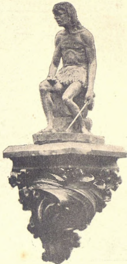
El fill pródich.—PIQUET.

—D' aquet modo et tens de coneixe. Volgué sapigué si 'l nas d' un es xato, ó 'ls llavis torts, ó 'l coló de pega... francament es pobre. La principal bellesa es l'ánima! Et miravas en els ulls de'ls teus que'et diuhen bo quant el poble no 't pot veure perque baix el teu nom fan las mes grans atrocitats. Are, si 't vols veure exteriorment, demanau als teus ministres, ells han trencat el mirall de 'l teu cos y de la teva ànima de la mateixa manera qu' han torsat el