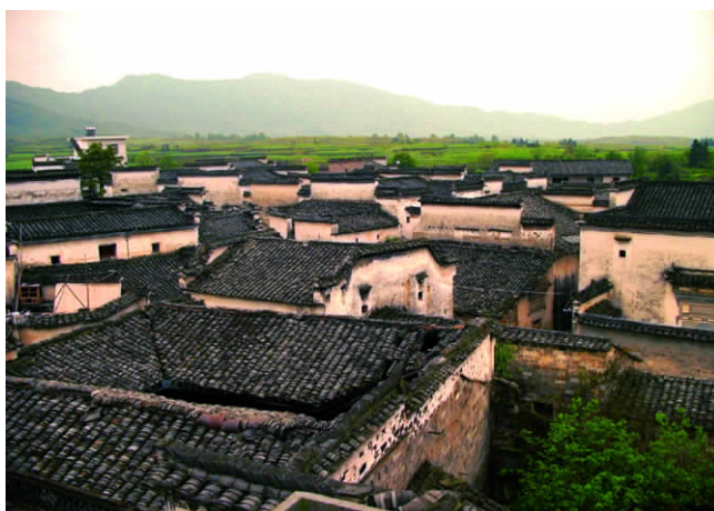
图 1 黟县南屏村

征。而建筑之“道”是自己系统中的内在法则,房屋便是相应的“器”。但是不同的认识产生的理论抽象程度不同,进而造就了不同的表现形式,产生出与之相符的“器”。