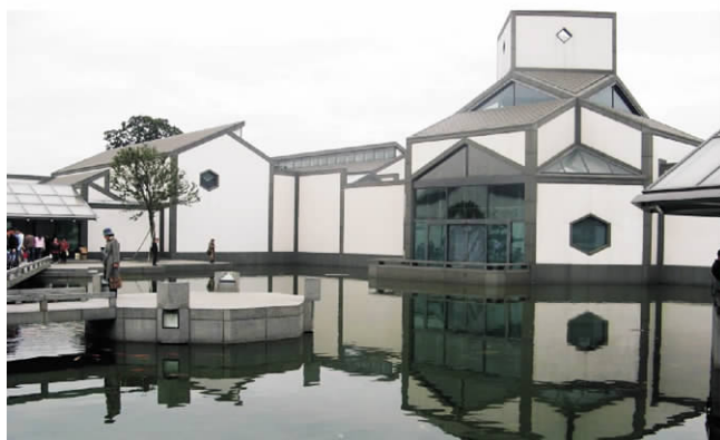
图6 苏州博物馆院内环境

世界上没有绝对静止的物体,所有的事物都是在不断运动变化中的,徽派建筑亦不例外。所以新徽派建筑应是一个开放的体系,以动态的思维来设计,使建筑具有足够的弹性,才能既满足现实需求,又能为未来的进一步改善发展留有余地。只有