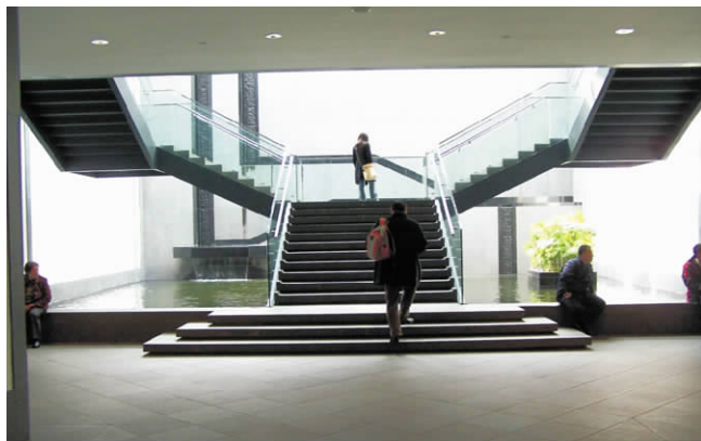
图7 苏州博物馆室内空间

提高建筑的灵活可变性,才能为人类提供更长久的服务,同时也是可持续发展的内在要求。具体包括预留管道空间,家具系统的可变性等。